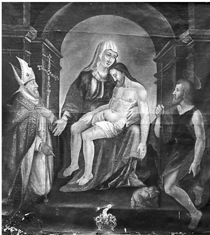
Vue générale. 25, Montgesoye