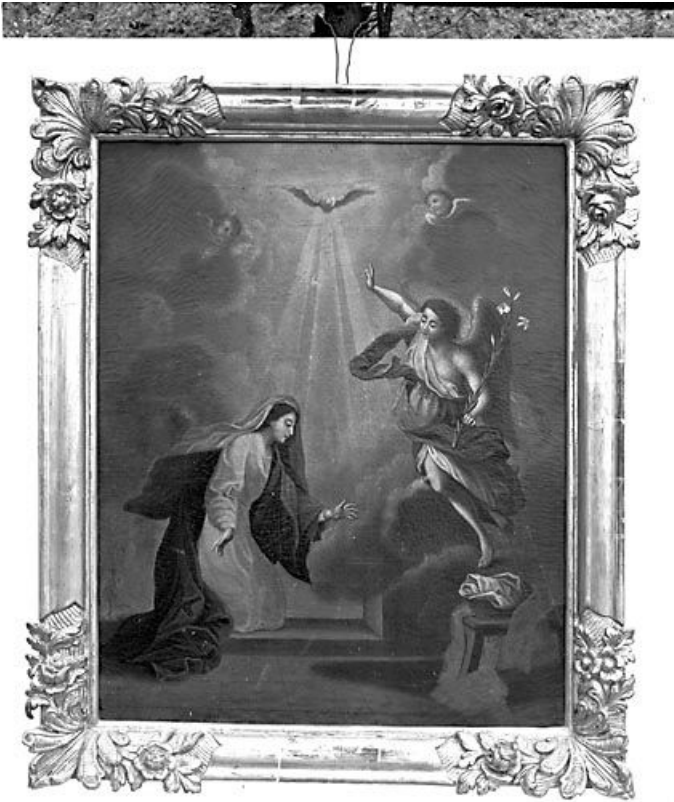
Vue générale. 25, Montgesoye