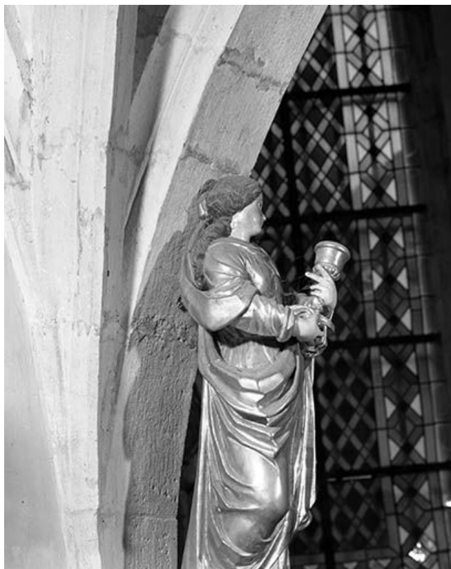
Vue de profil droit.