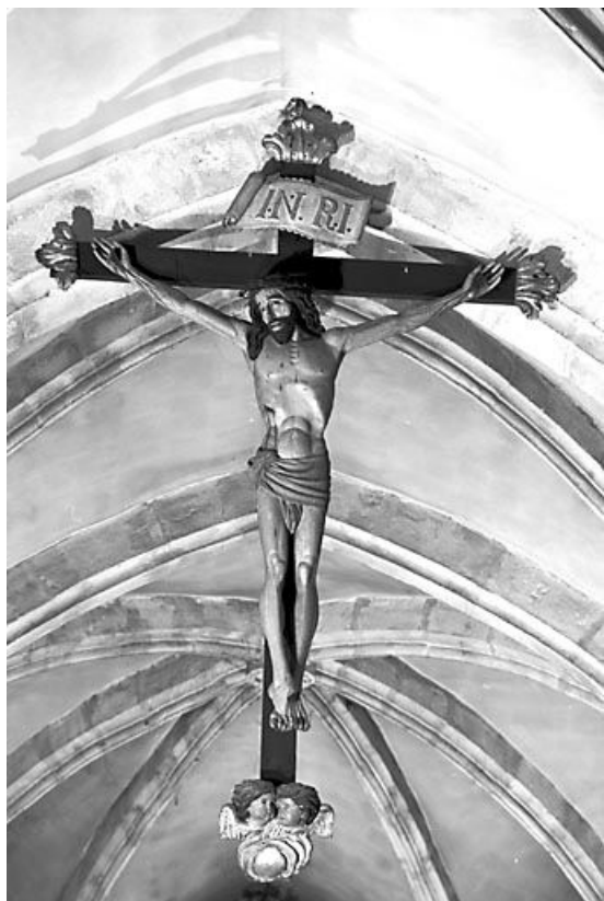
Christ en croix.