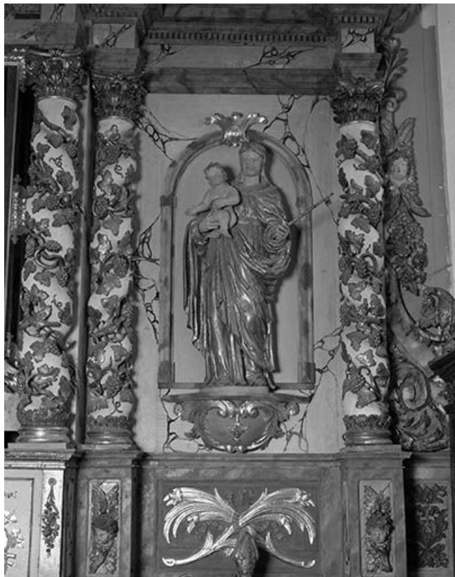
Vierge à l'Enfant. 25, Scey-Maisières