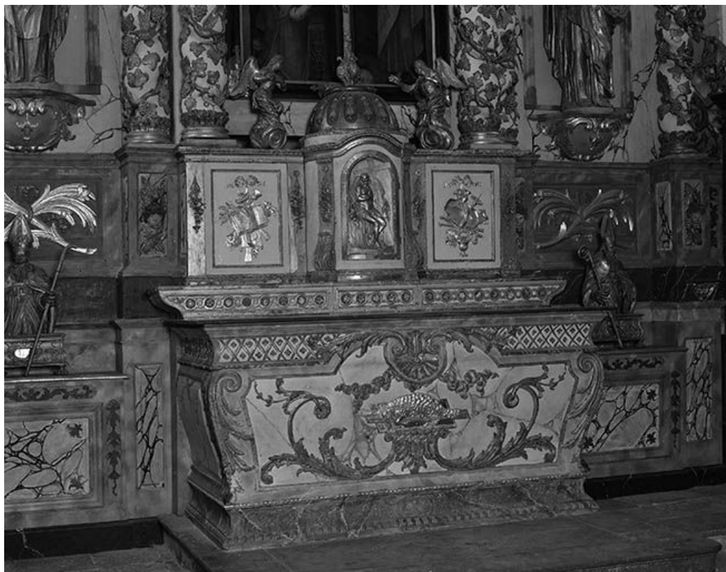
Le maître-autel. 25, Scey-Maisières