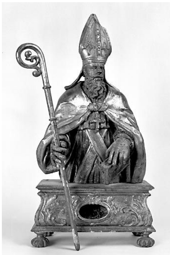
Saint Pierre de Tarentaise. 25, Scey-Maisières