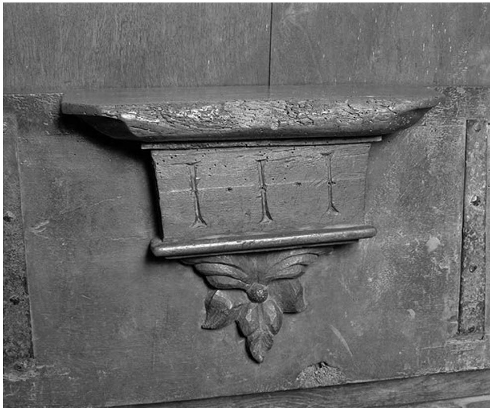
Détail : misericorde côté nord n° 3.