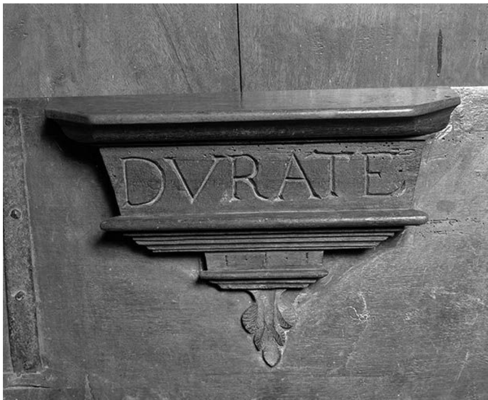
Détail : miséricorde côté nord n° 1. 25, Lods