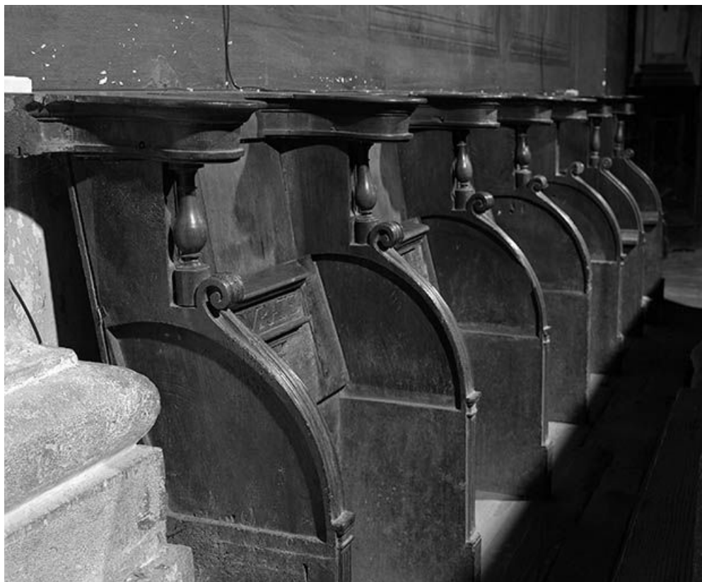
Vue d'ensemble rapprochée du côté nord. 25, Lods