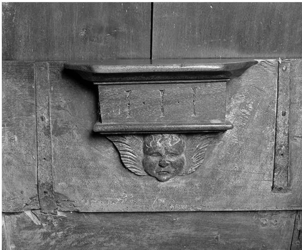
Détail : miséricorde côté sud n° 1.