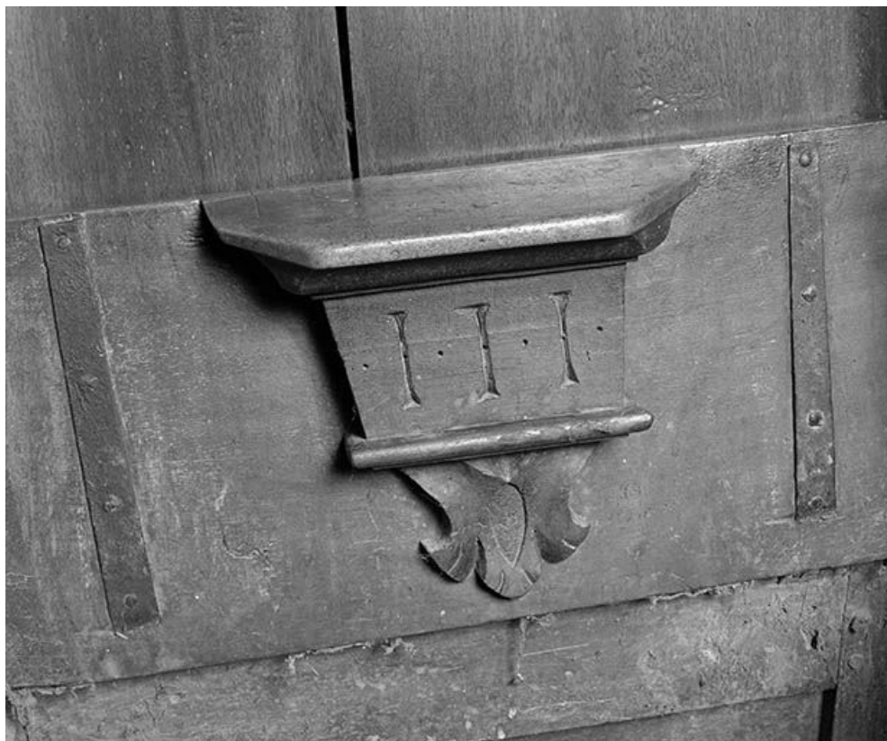
Détail : misericorde côté sud n° 4. 25, Lods