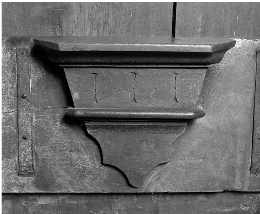
Détail : misericorde côté nord n° 4.