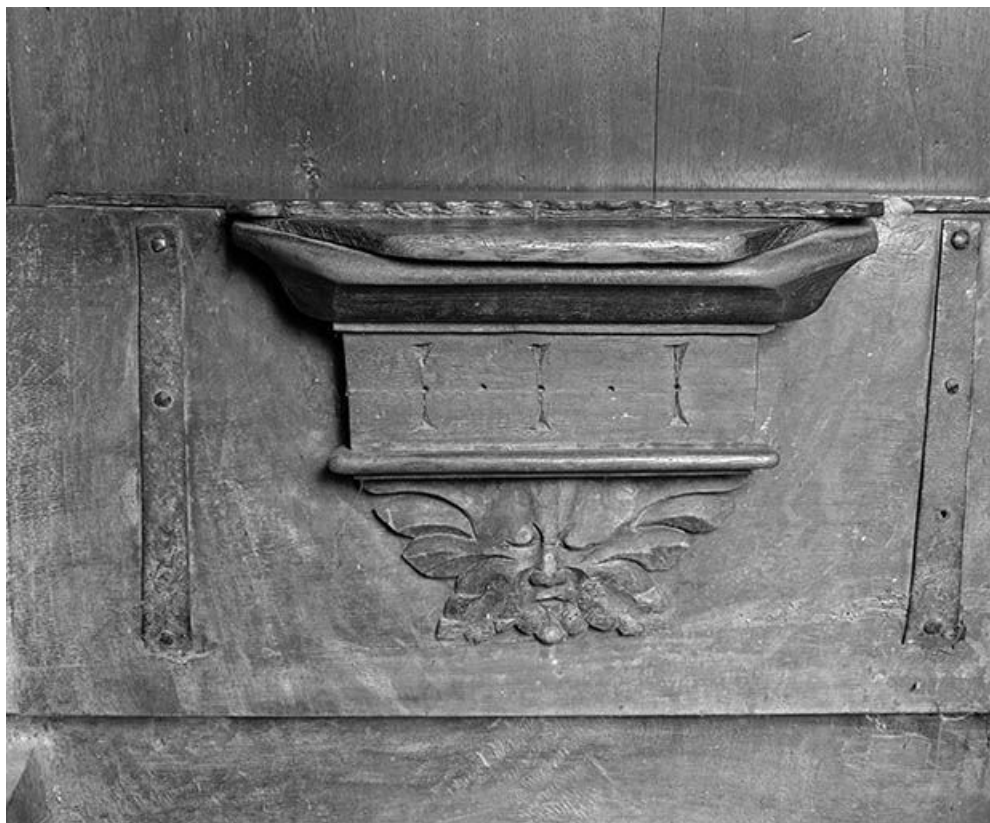
Détail : miséricorde côté sud n° 2.