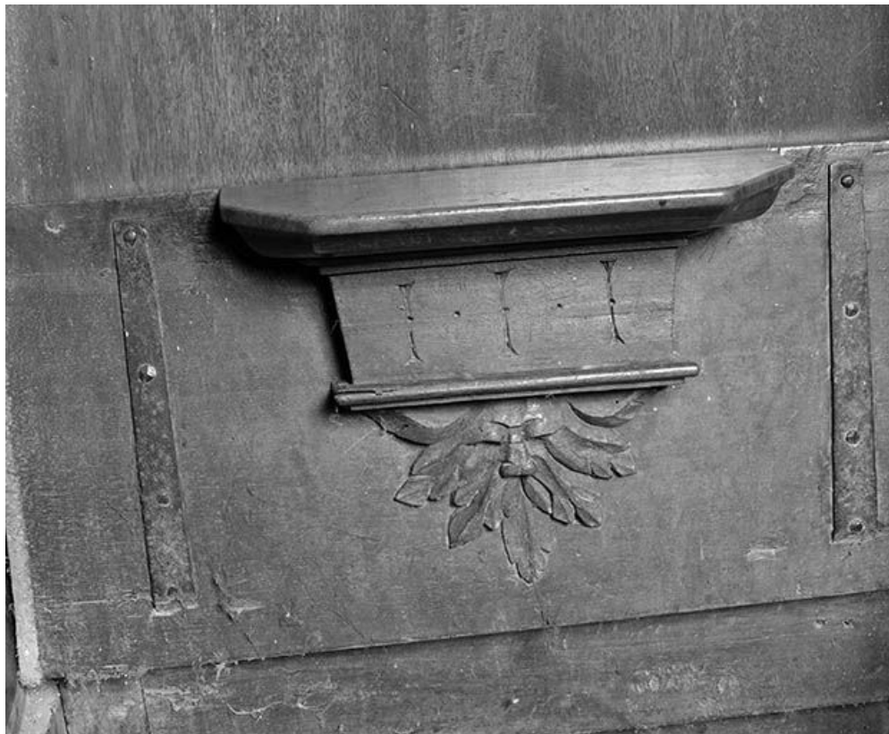
Détail : miséricorde côté sud n° 3.