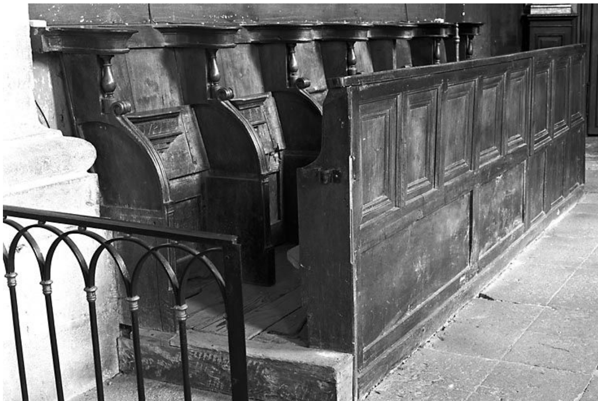
Vue d'ensemble du côté nord. 25, Lods