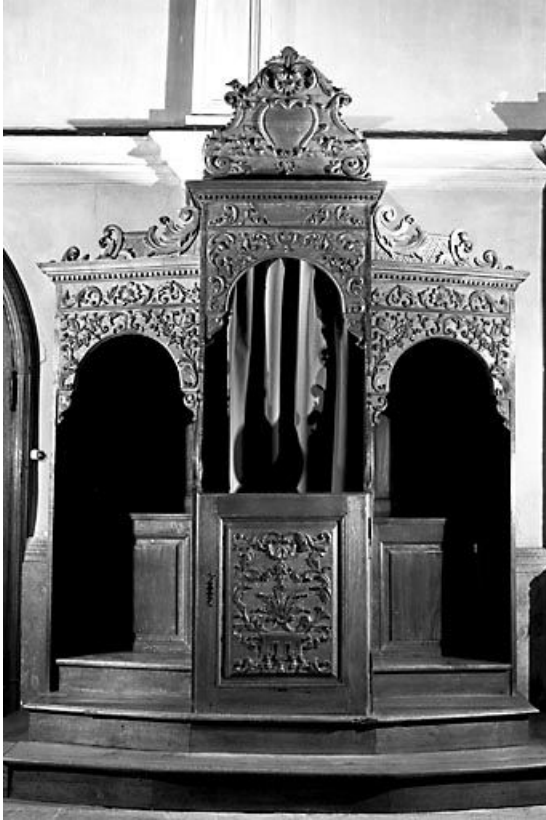
Vue d'ensemble d'un confessionnal.