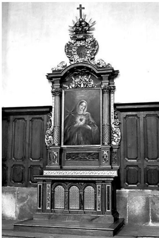
Vue d'ensemble de l'autel du Sacré-Coeur de Marie. 25, Ornans, 7 rue Edouard Bastide