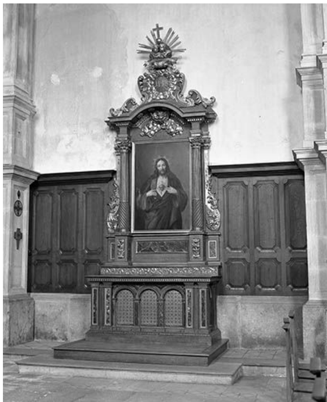
Vue d'ensemble de l'autel du Sacré-Coeur de Jésus.