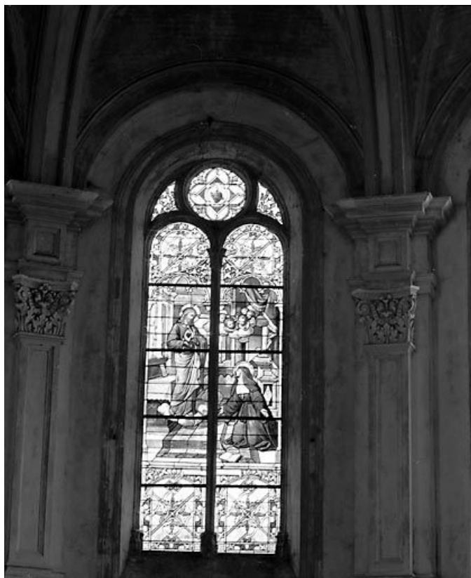
Baie 0 : Apparition du Sacré-Coeur à Marguerite Marie Alacoque. 25, Ornans, 7 rue Edouard Bastide