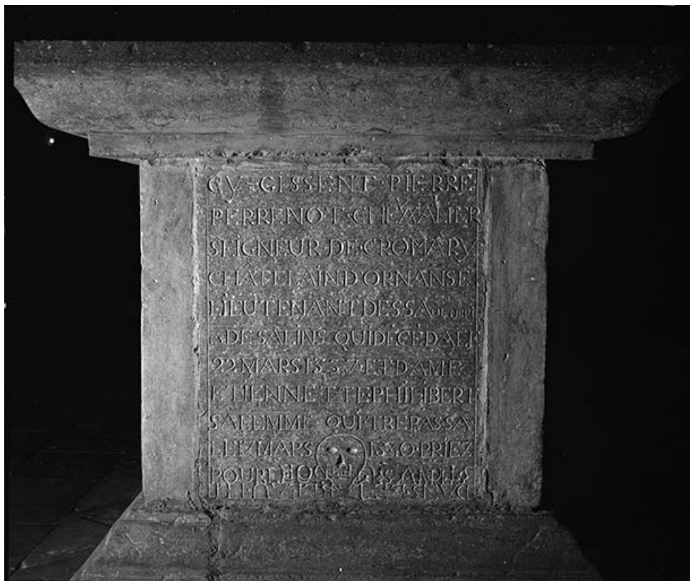
Détail : l'épithaphe.