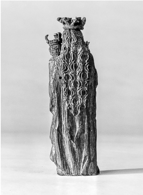
Détail : la statuette de la Vierge, vue du revers.