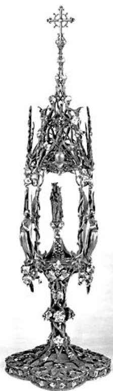
Vue d'ensemble avec la statuette de la Vierge couronnée.