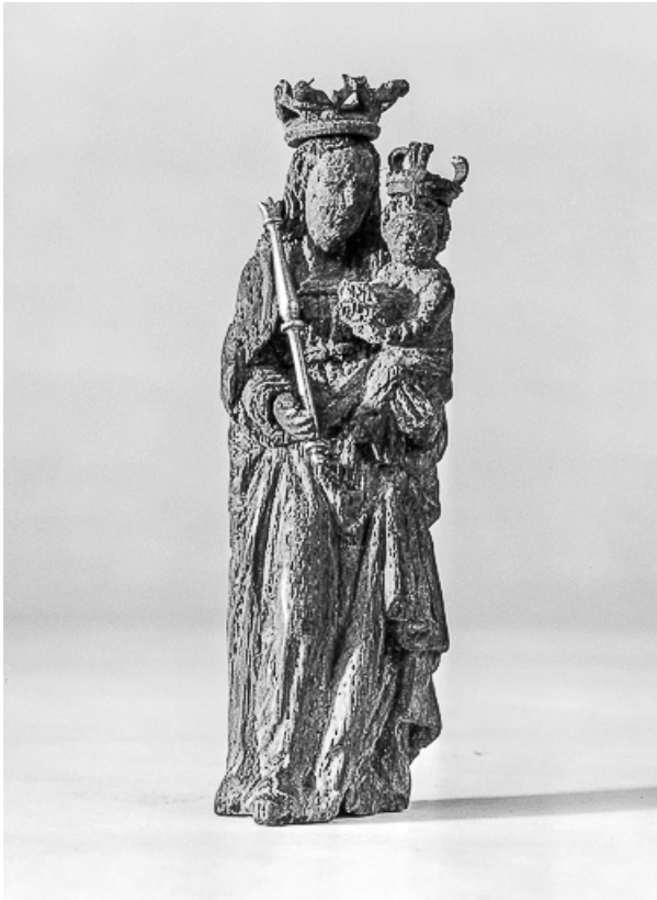
Détail : la statuette de la Vierge, vue de face.