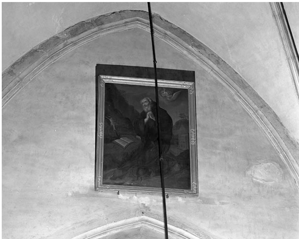
Saint François de Paule.