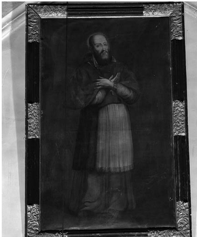
Saint François de Sales.