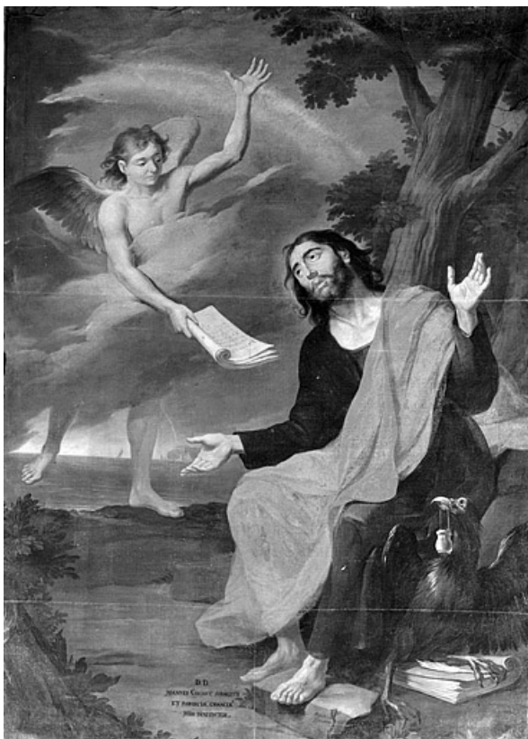
Saint Jean l'Evangéliste.