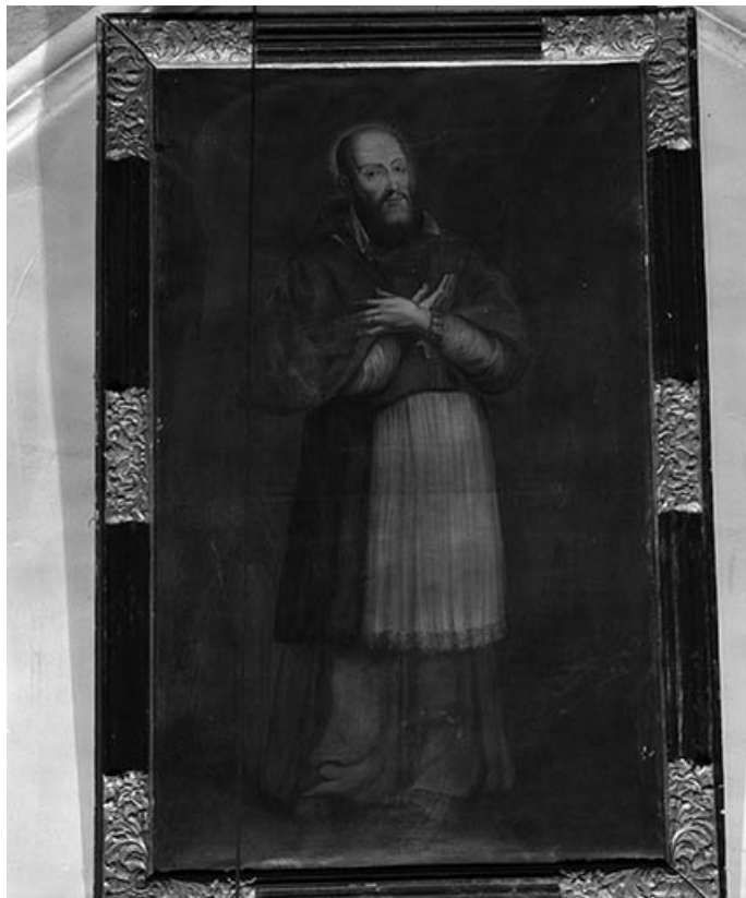
Saint François de Sales.