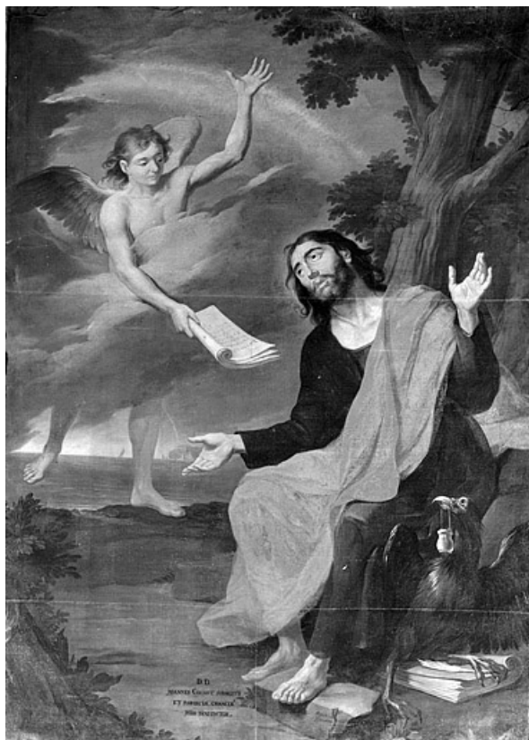
Saint Jean l'Evangéliste.