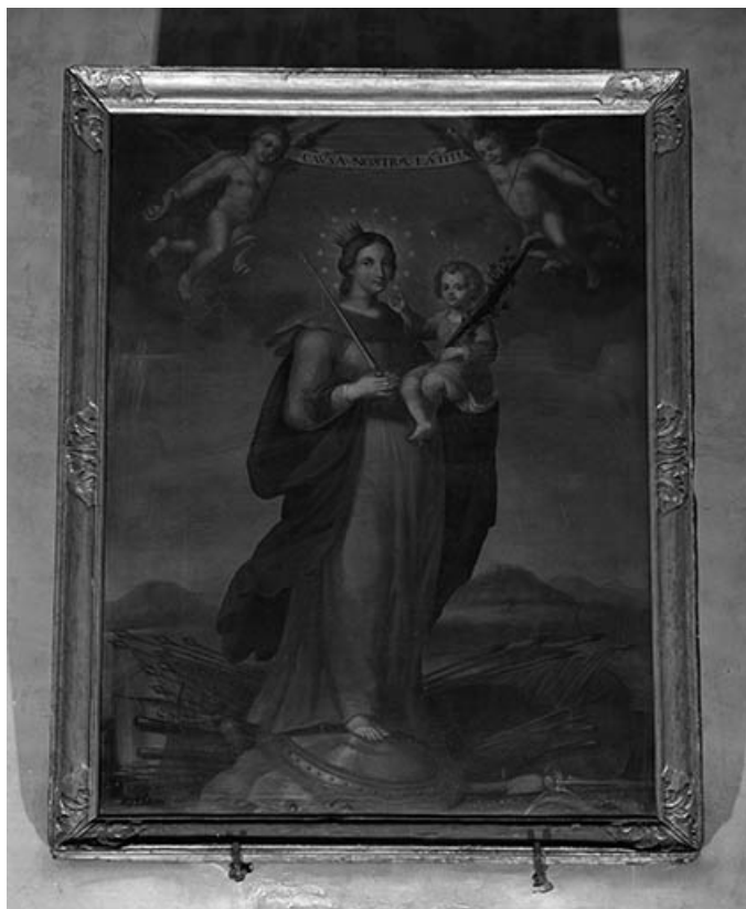
Vierge à l'Enfant.