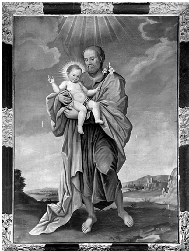
Saint Joseph et l'Enfant (n° 1).