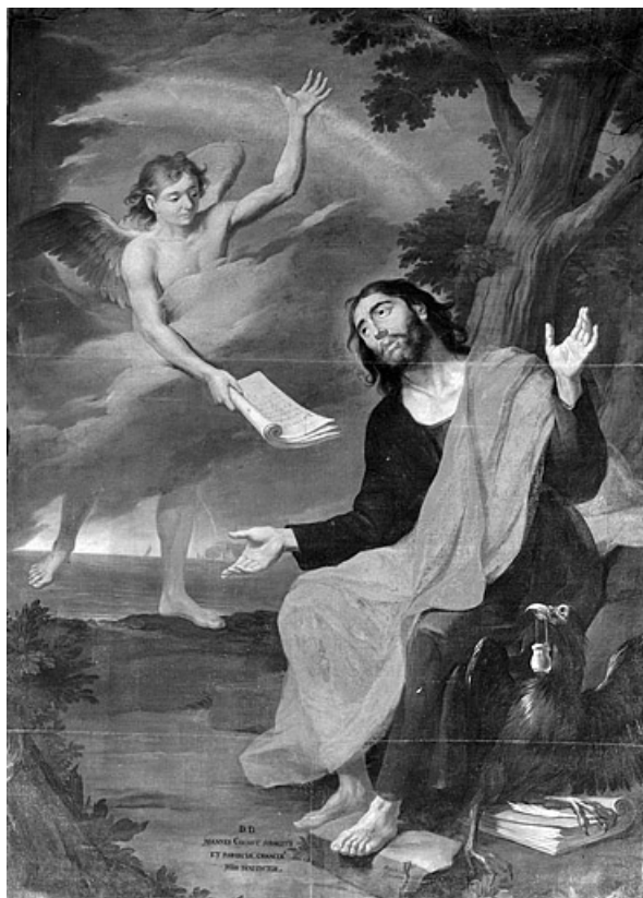
Saint Jean l'Evangéliste.