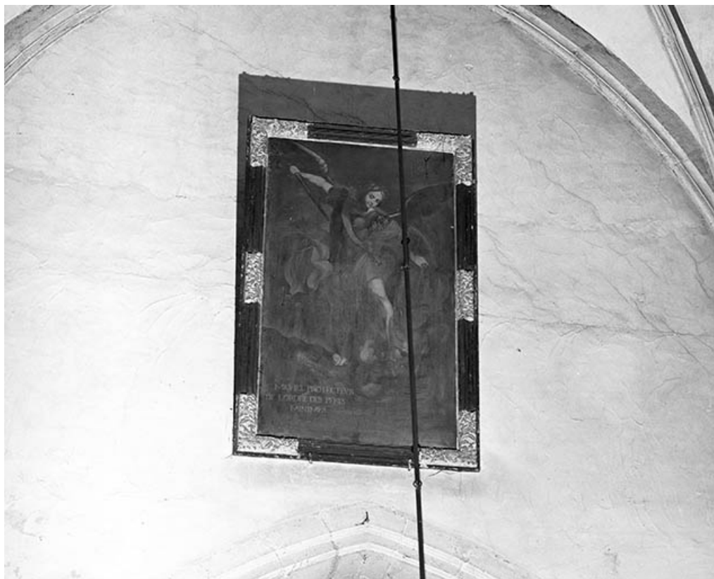
Saint Michel terrassant le dragon.