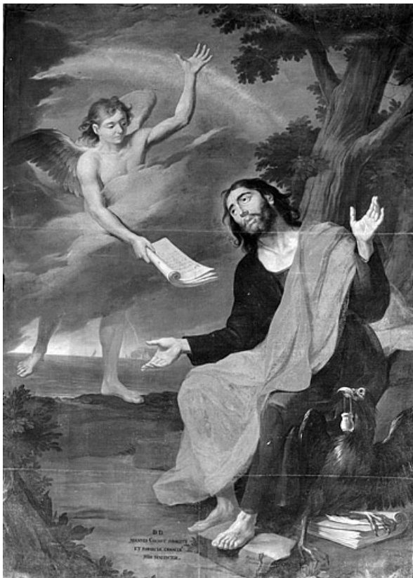
Saint Jean l'Evangéliste.