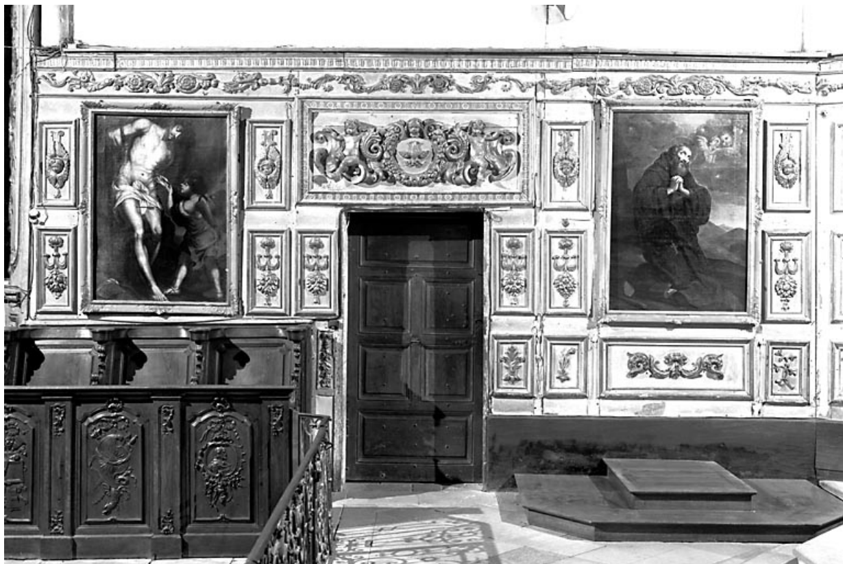
Vue d'ensemble du côté gauche. 25, Ornans rue Saint-Laurent