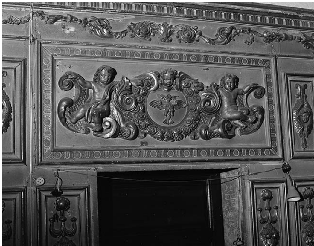
Détail des panneaux au-dessus de la porte conduisant à la sacristie nord. 25, Ornans rue Saint-Laurent