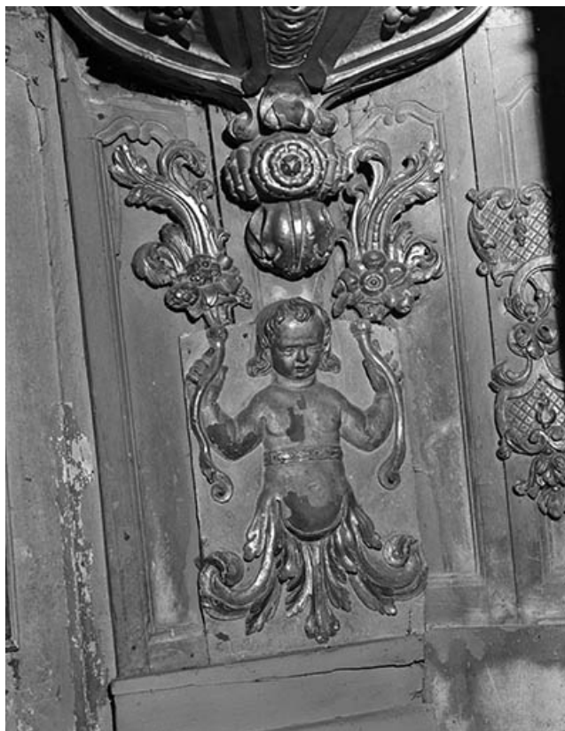
Détail : faune situé sous la niche de la Vierge à l'Enfant. 25, Ornans rue Saint-Laurent