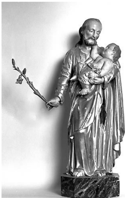
Vue de face. 25, Malbrans