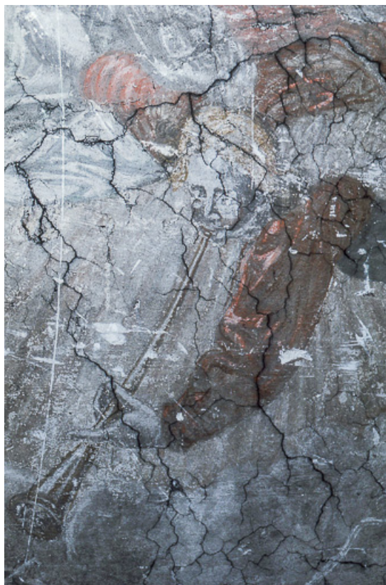
Le Jugement dernier : angelot jouant de la trompette. 25, Ornans rue Saint-Laurent