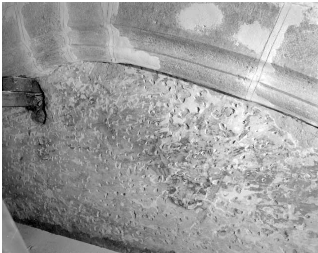
Détail de la scène au niveau de la tribune. 25, Ornans rue Saint-Laurent