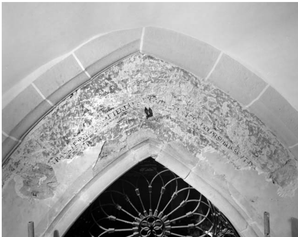
Inscription au-dessus de la porte conduisant à la nef.