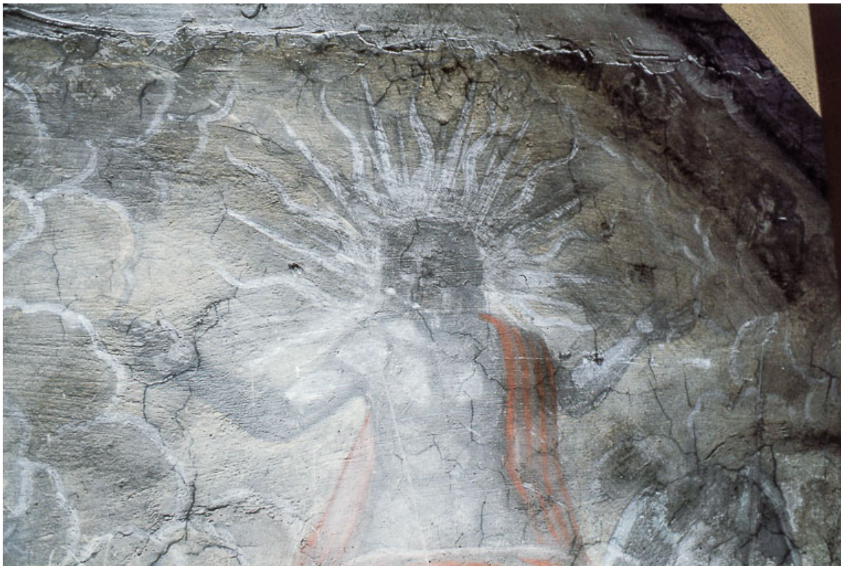
Le Jugement dernier : tête et tronc du Christ.