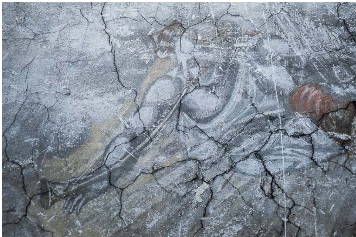
Le Jugement dernier : joueur de trompette.