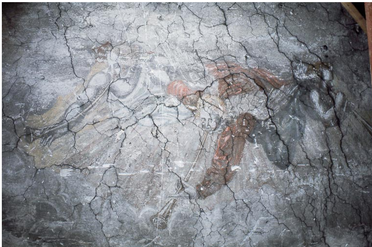
Le Jugement dernier : trois personnages soufflant dans leur trompette.