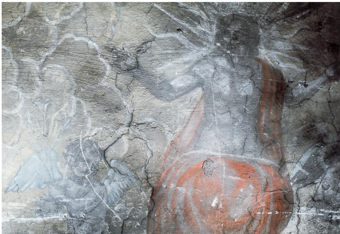
Le Jugement dernier : le Christ et un ange.