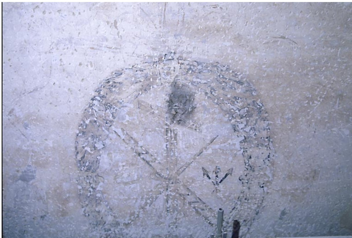
Mur nord de la 1ère travée de la nef. 25, Ornans rue Saint-Laurent