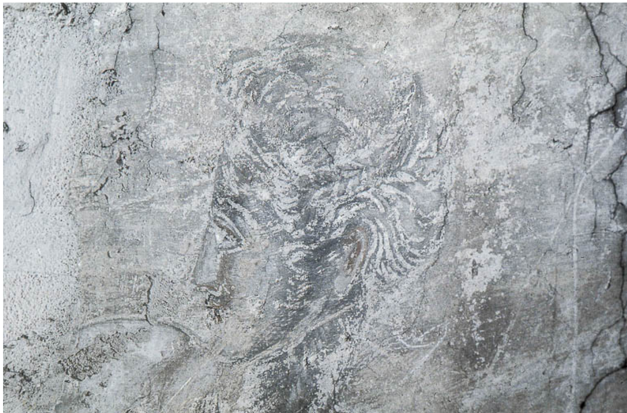
Le Jugement dernier : profil gauche de visage.