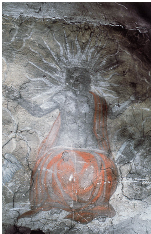
Le Jugement dernier : Christ vu de face.