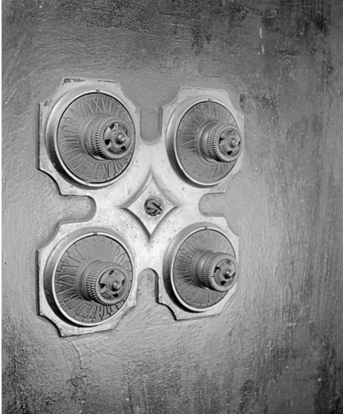
Détail de la serrure à combinaison. Vue de trois quarts gauche.

25, Baume-les-Dames rue des Pipes, lieudit : Gondé