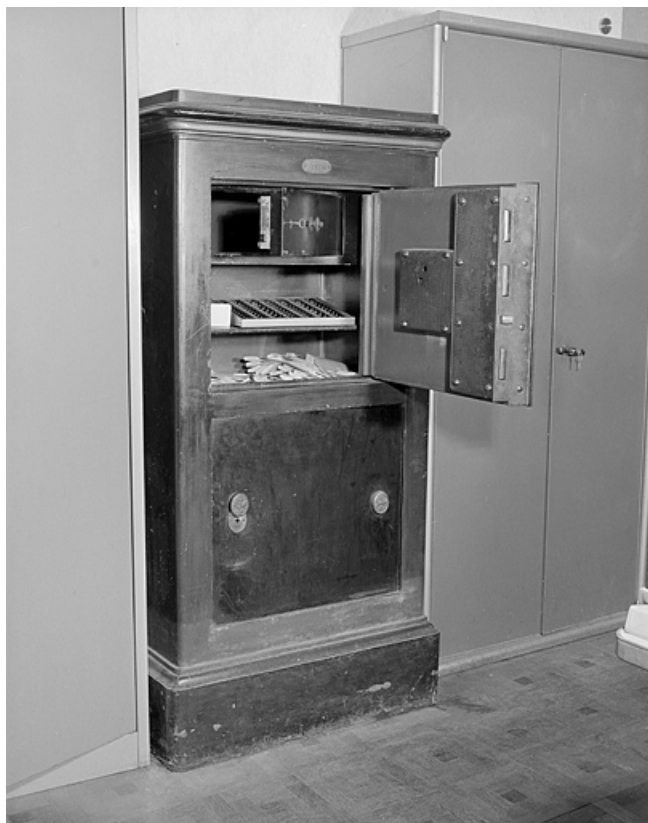
Vue d'ensemble. Compartiment supérieur ouvert. 25, Baume-les-Dames rue des Pipes, lieudit : Gondé