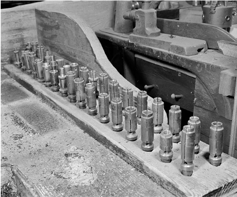
Jeu d'embouts de tailles différentes posés sur l'établi.

25, Baume-les-Dames rue des Pipes, lieudit : Gondé