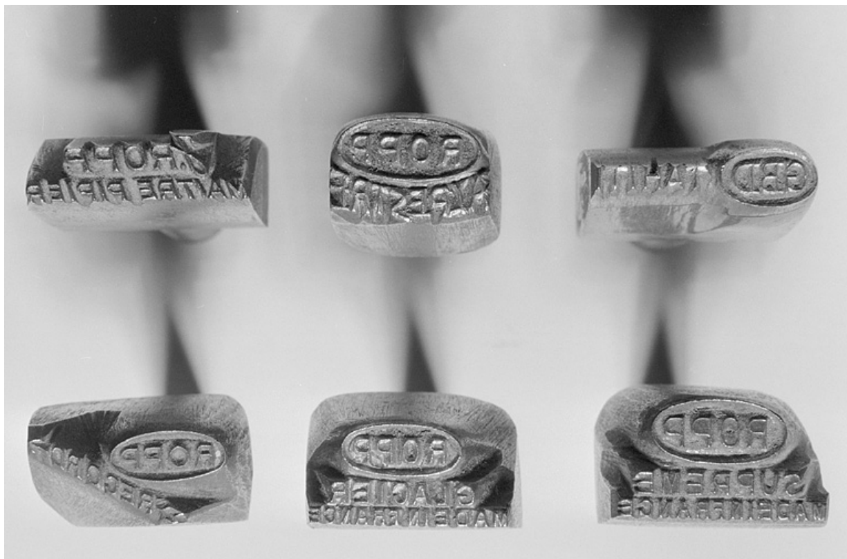
Ensemble de six poinçons de la société.

25, Baume-les-Dames rue des Pipes, lieudit : Gondé