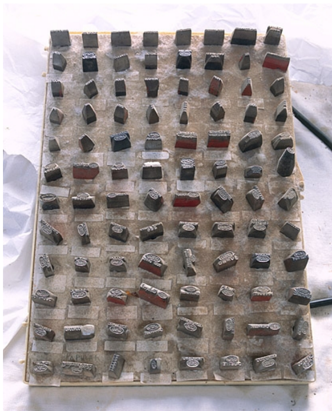
Plateau de poinçons de la société.

25, Baume-les-Dames rue des Pipes, lieudit : Gondé