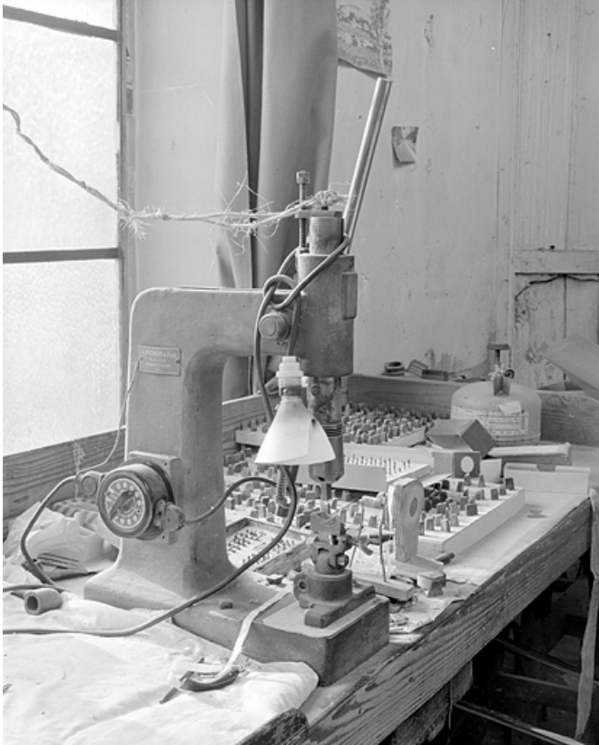
Vue de trois quarts gauche.

25, Baume-les-Dames rue des Pipes, lieudit : Gondé