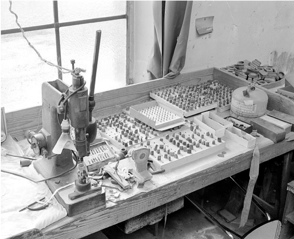
Vue d'ensemble avec le poste de travail.

25, Baume-les-Dames rue des Pipes, lieudit : Gondé