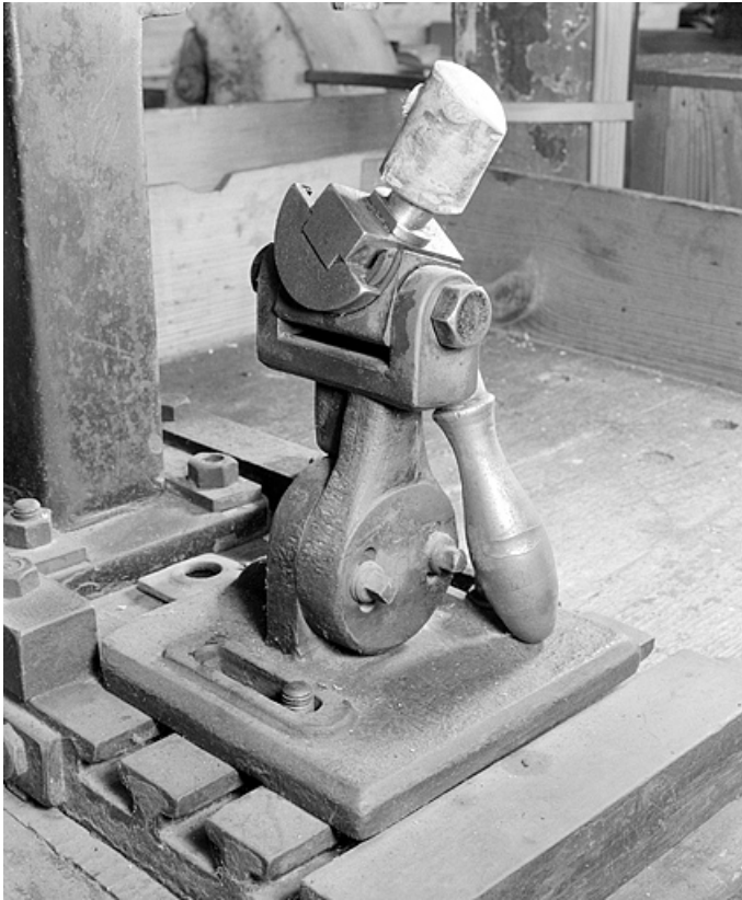
Fourneau enfoncé sur le culot amovible. Vue de trois quarts gauche. 25, Baume-les-Dames rue des Pipes, lieudit : Gondé