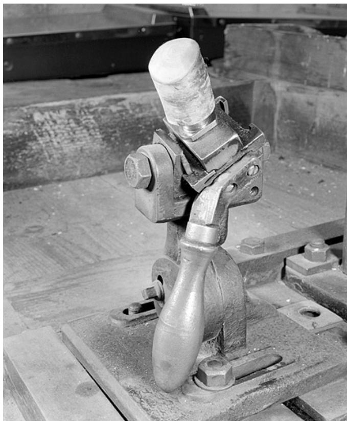
Fourneau enfoncé sur le culot amovible. Vue de trois quarts droite. 25, Baume-les-Dames rue des Pipes, lieudit : Gondé