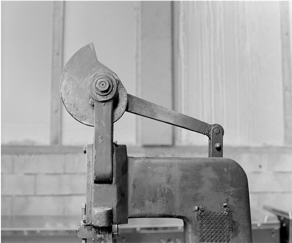
Vue de profil de la came.

25, Baume-les-Dames rue des Pipes, lieudit : Gondé