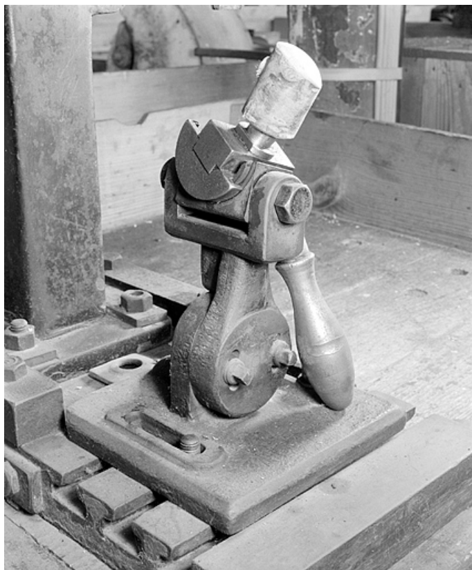
Fourneau enfoncé sur le culot amovible. Vue de trois quarts gauche. 25, Baume-les-Dames rue des Pipes, lieudit : Gondé