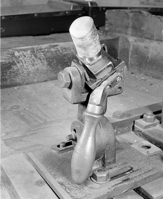
Fourneau enfoncé sur le culot amovible. Vue de trois quarts droite. 25, Baume-les-Dames rue des Pipes, lieudit : Gondé