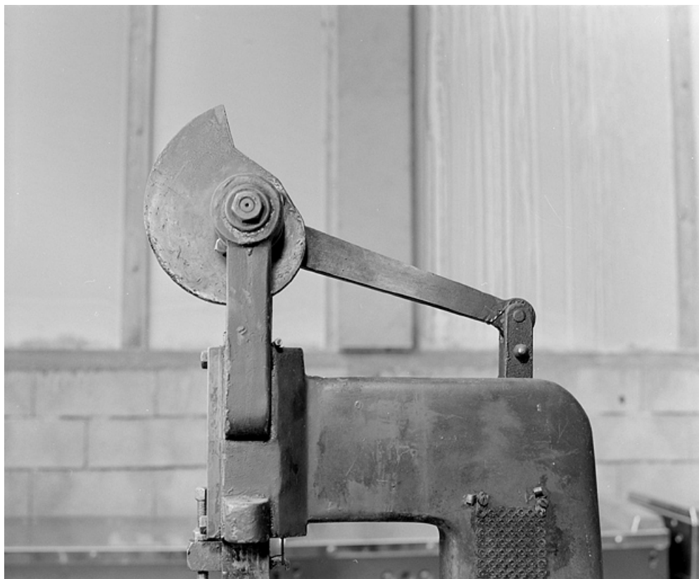
Vue de profil de la came.

25, Baume-les-Dames rue des Pipes, lieudit : Gondé