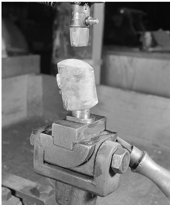
Détail du culot amovible présentant un fourneau dans l'axe de descente du poinçon.

25, Baume-les-Dames rue des Pipes, lieudit : Gondé