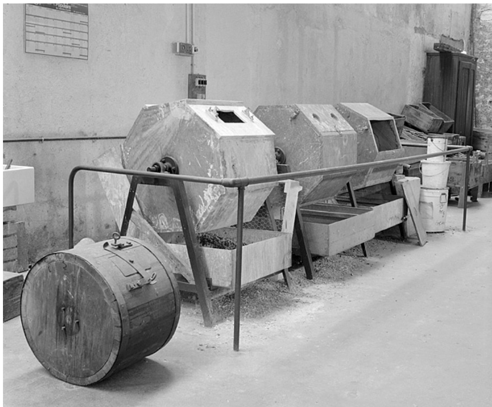
Vue d'ensemble avec, posé à gauche, un ancien modèle de tonneau.

25, Baume-les-Dames rue des Pipes, lieudit : Gondé