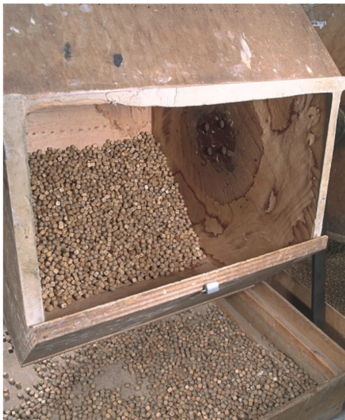
L'intérieur du tonneau central, son bac et les cubes de hêtre qu'ils contiennent.

25, Baume-les-Dames rue des Pipes, lieudit : Gondé