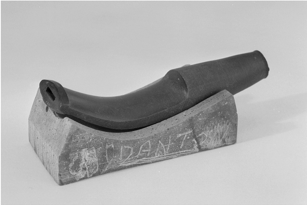
Détail d'un tuyau en ébonite moulé dans son marbre.

25, Baume-les-Dames rue des Pipes, lieudit : Gondé