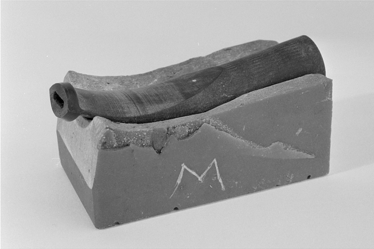
Détail d'un tuyau en ébonite moulé dans son marbre.

25, Baume-les-Dames rue des Pipes, lieudit : Gondé