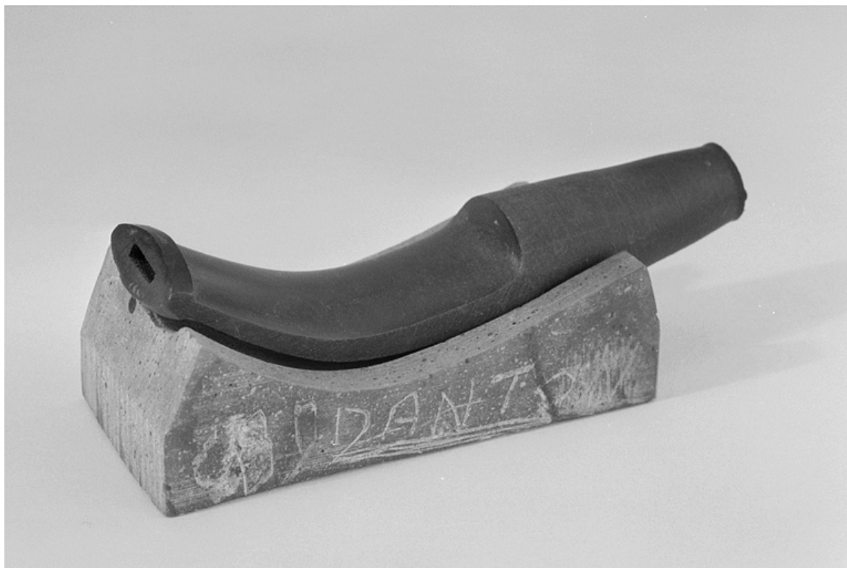
Détail d'un tuyau en ébonite moulé dans son marbre.

25, Baume-les-Dames rue des Pipes, lieudit : Gondé