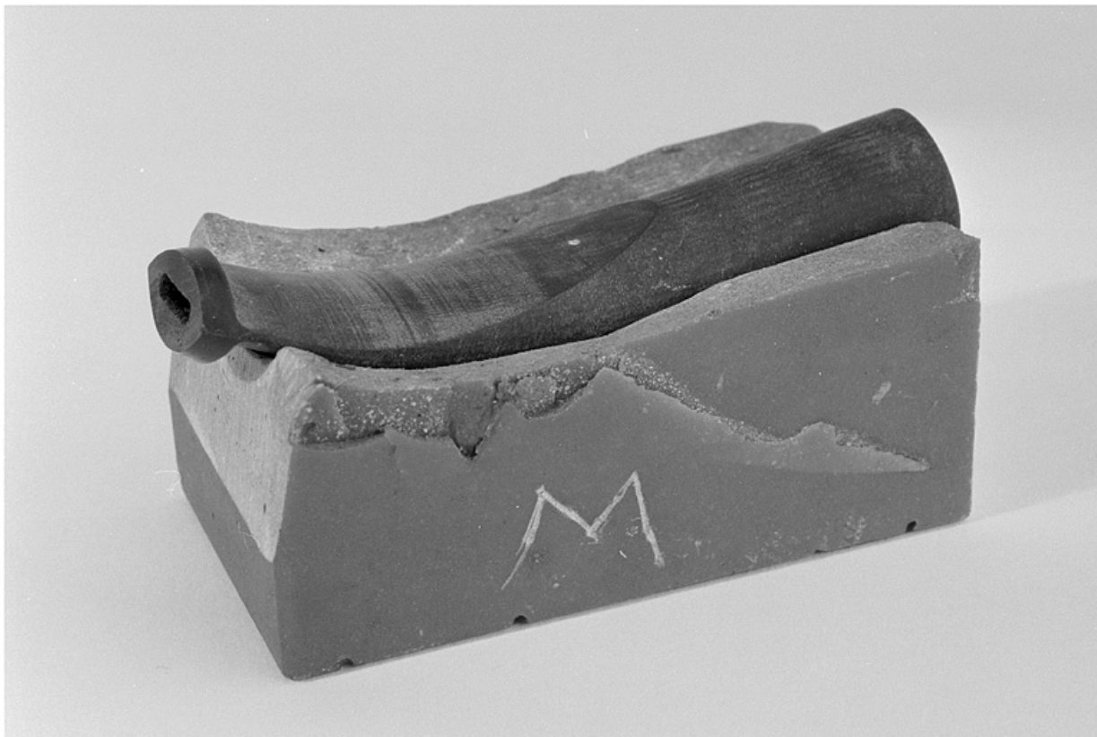
Détail d'un tuyau en ébonite moulé dans son marbre.

25, Baume-les-Dames rue des Pipes, lieudit : Gondé