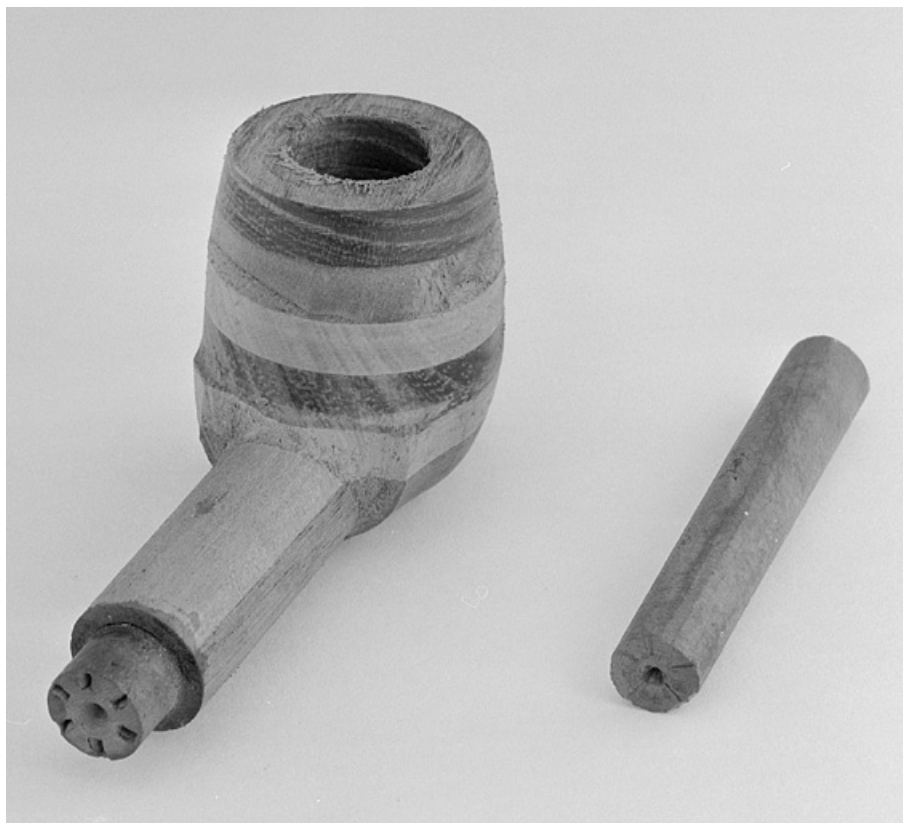
Détail d'un tuyau de bois et d'un second, inséré dans la tige d'une pipe en contreplaqué. 25, Baume-les-Dames rue des Pipes, lieudit : Gondé