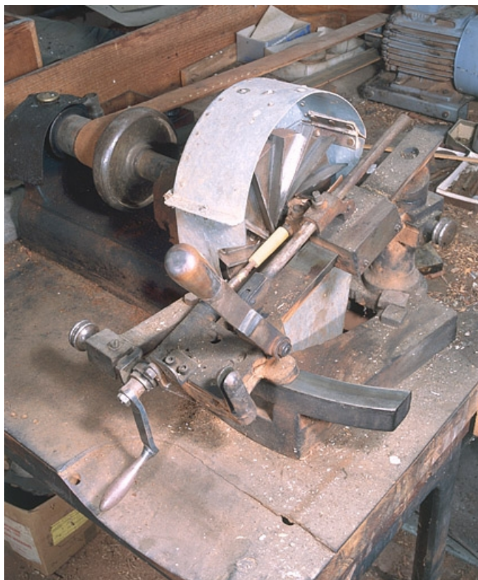
Vue de la pièce à usiner au contact des ciseaux de la fraise.

25, Baume-les-Dames rue des Pipes, lieudit : Gondé