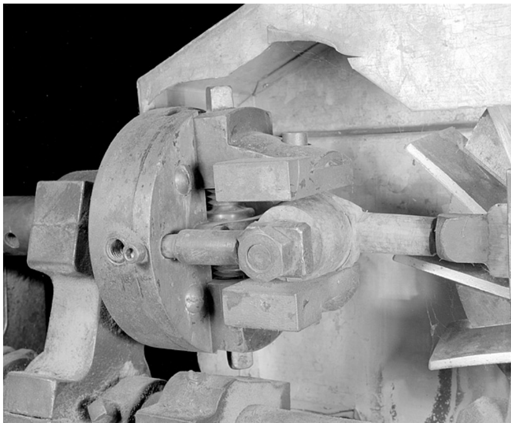
La fraise et le mandrin "gueule de loup".

25, Baume-les-Dames rue des Pipes, lieudit : Gondé