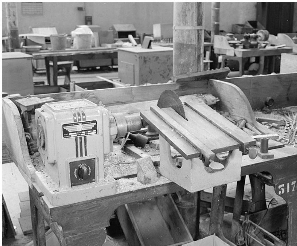
Vue d'ensemble de la scie (atelier principal).

25, Baume-les-Dames rue des Pipes, lieudit : Gondé