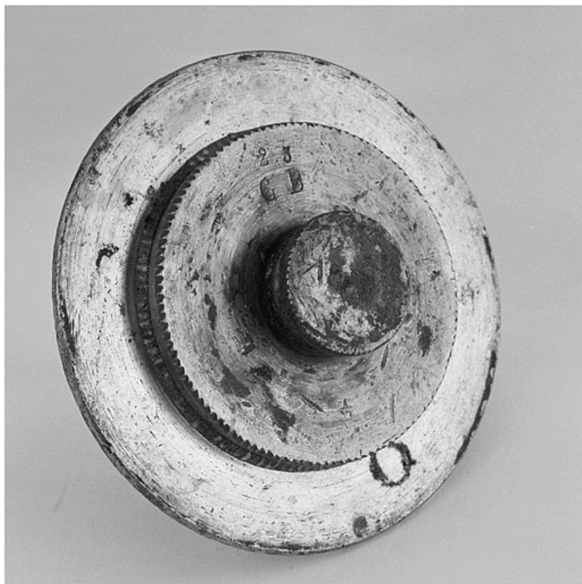
Détail d'un outil de coupe. Vue de face.

25, Baume-les-Dames rue des Pipes, lieudit : Gondé