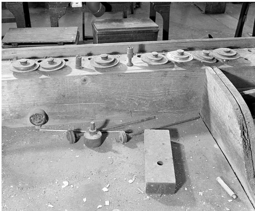
Jeu d'outils de tailles différentes posés sur l'établi.

25, Baume-les-Dames rue des Pipes, lieudit : Gondé