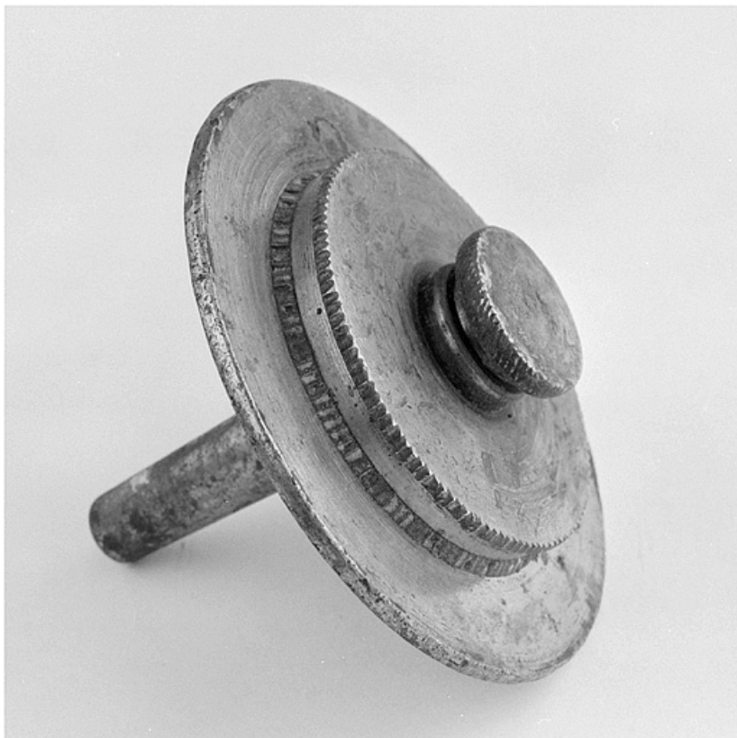
Détail d'un outil de coupe, montrant de profil les trois disques qui chanfreinent. 25, Baume-les-Dames rue des Pipes, lieudit : Gondé