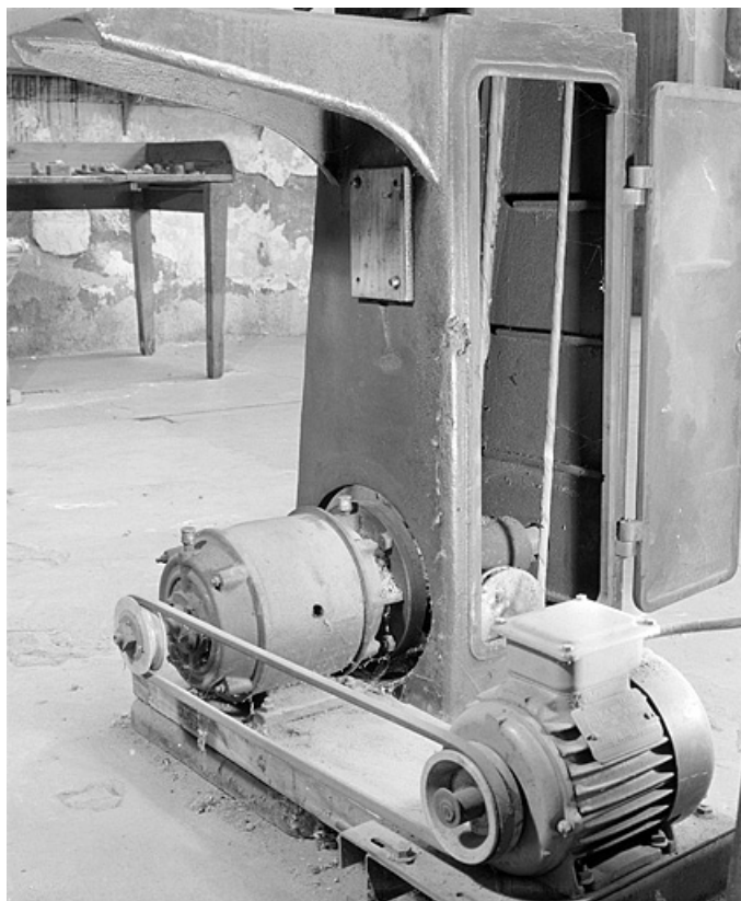
Vue des deux moteurs couplés.

25, Baume-les-Dames rue des Pipes, lieudit : Gondé