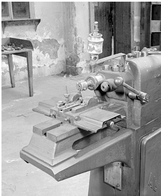
Vue d'ensemble rapprochée.

25, Baume-les-Dames rue des Pipes, lieudit : Gondé