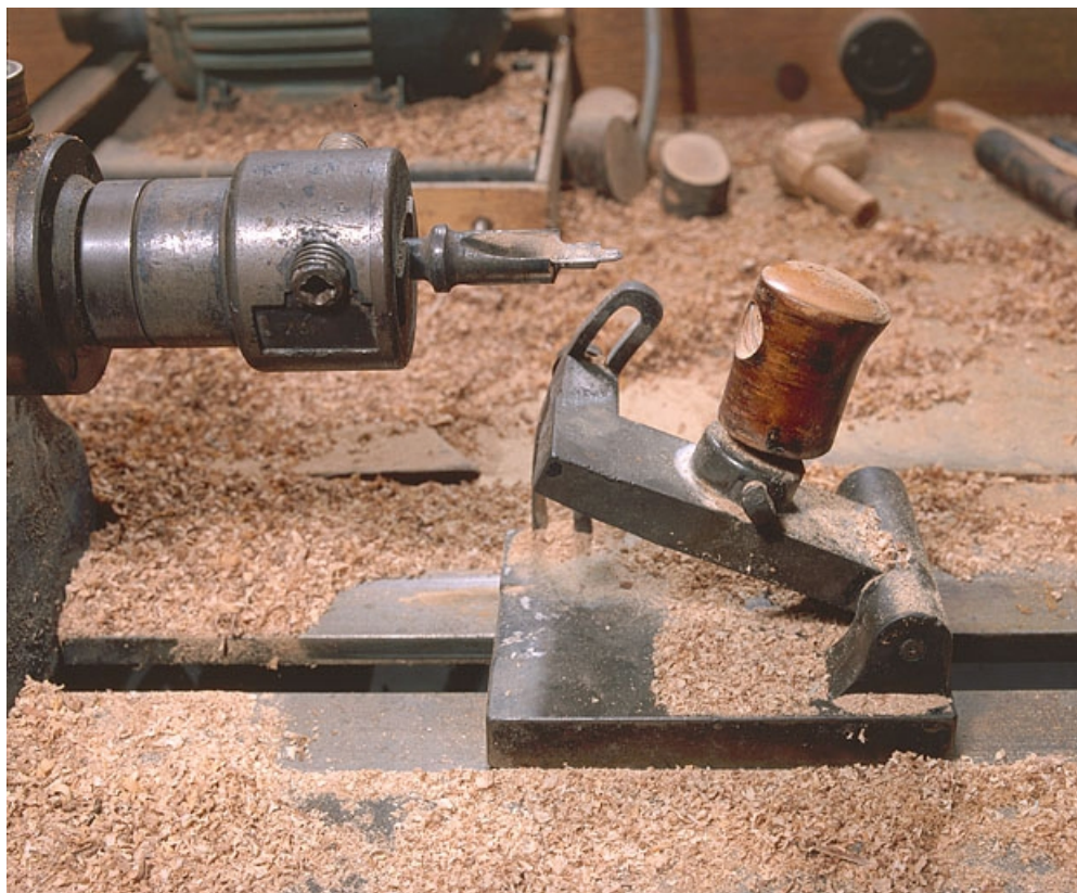
La cuillère et lui, faisant face, le fourneau à usiner sur son chariot mobile.

25, Baume-les-Dames rue des Pipes, lieudit : Gondé