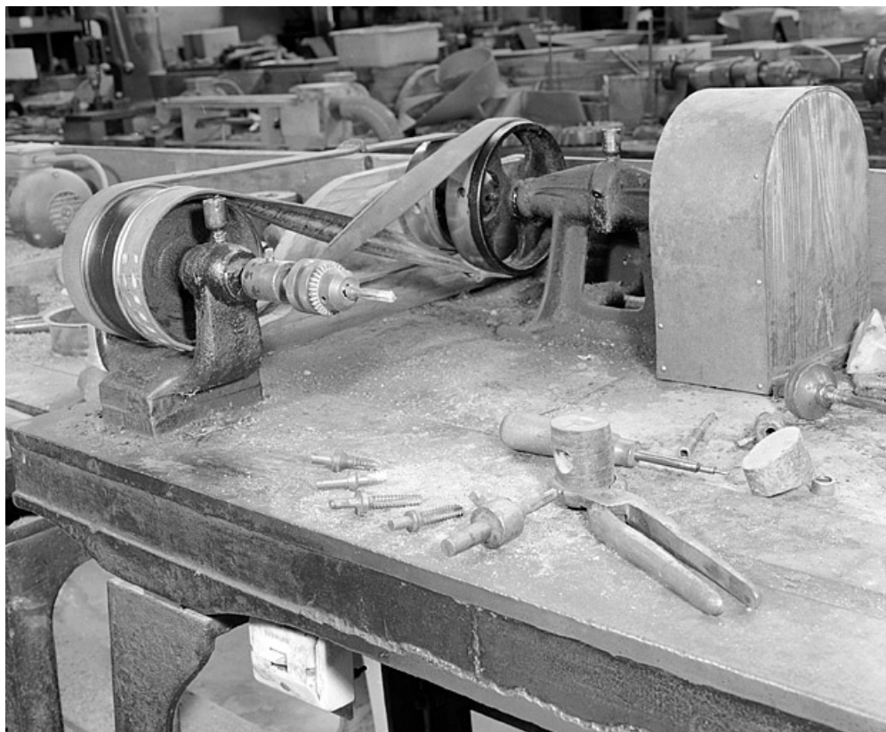
Vue d'ensemble rapprochée de trois quarts droite.

25, Baume-les-Dames rue des Pipes, lieudit : Gondé