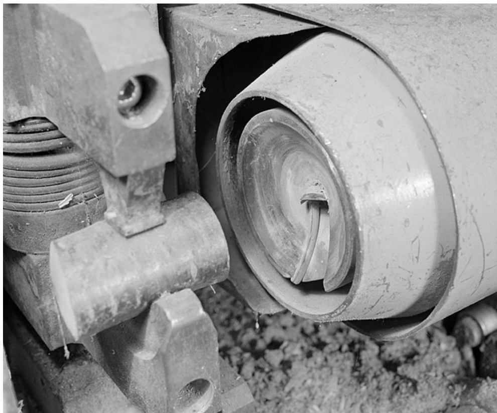
Détail de l'outil de coupe côté droit.

25, Baume-les-Dames rue des Pipes, lieudit : Gondé