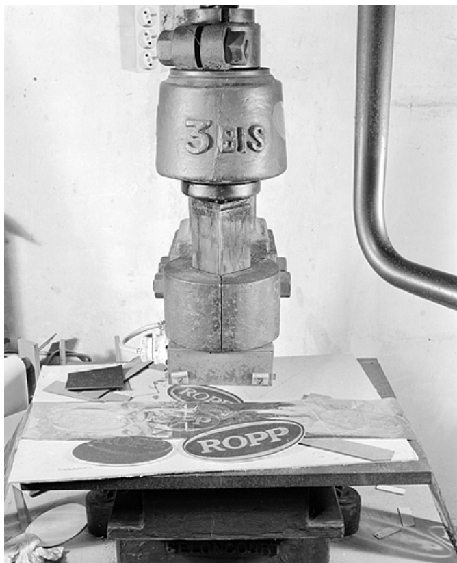
Détail de la table et de l'organe marqueur.

25, Baume-les-Dames rue des Pipes, lieudit : Gondé