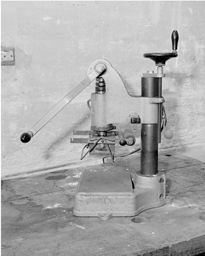
Vue de côté.

25, Baume-les-Dames rue des Pipes, lieudit : Gondé