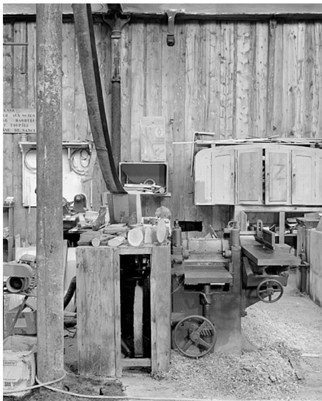
Vue de face, avec la transmission par courroie.

25, Baume-les-Dames rue des Pipes, lieudit : Gondé