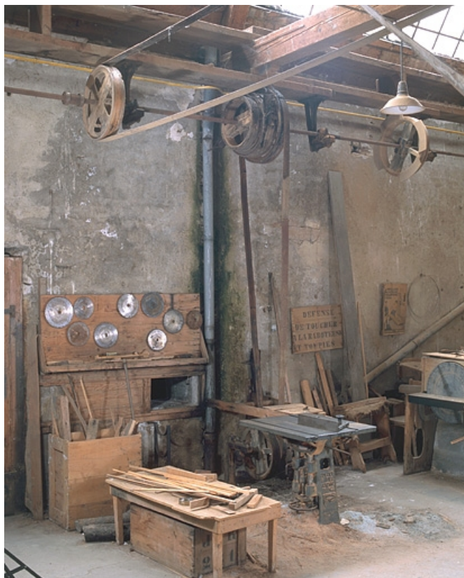
Vue d'ensemble avec le système de transmission.

25, Baume-les-Dames rue des Pipes, lieudit : Gondé