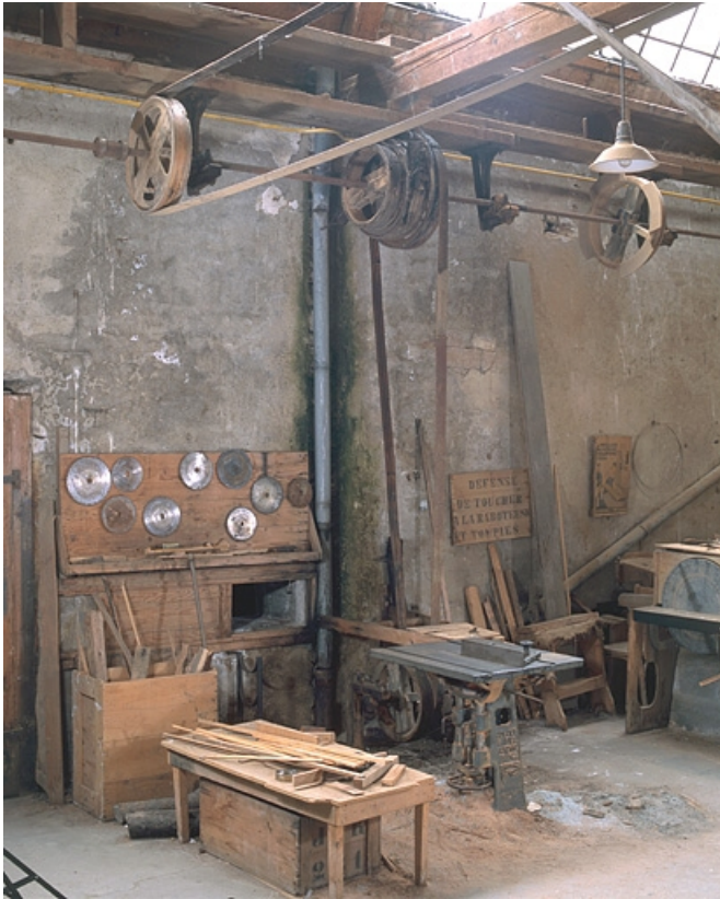
Vue d'ensemble avec le système de transmission.

25, Baume-les-Dames rue des Pipes, lieudit : Gondé