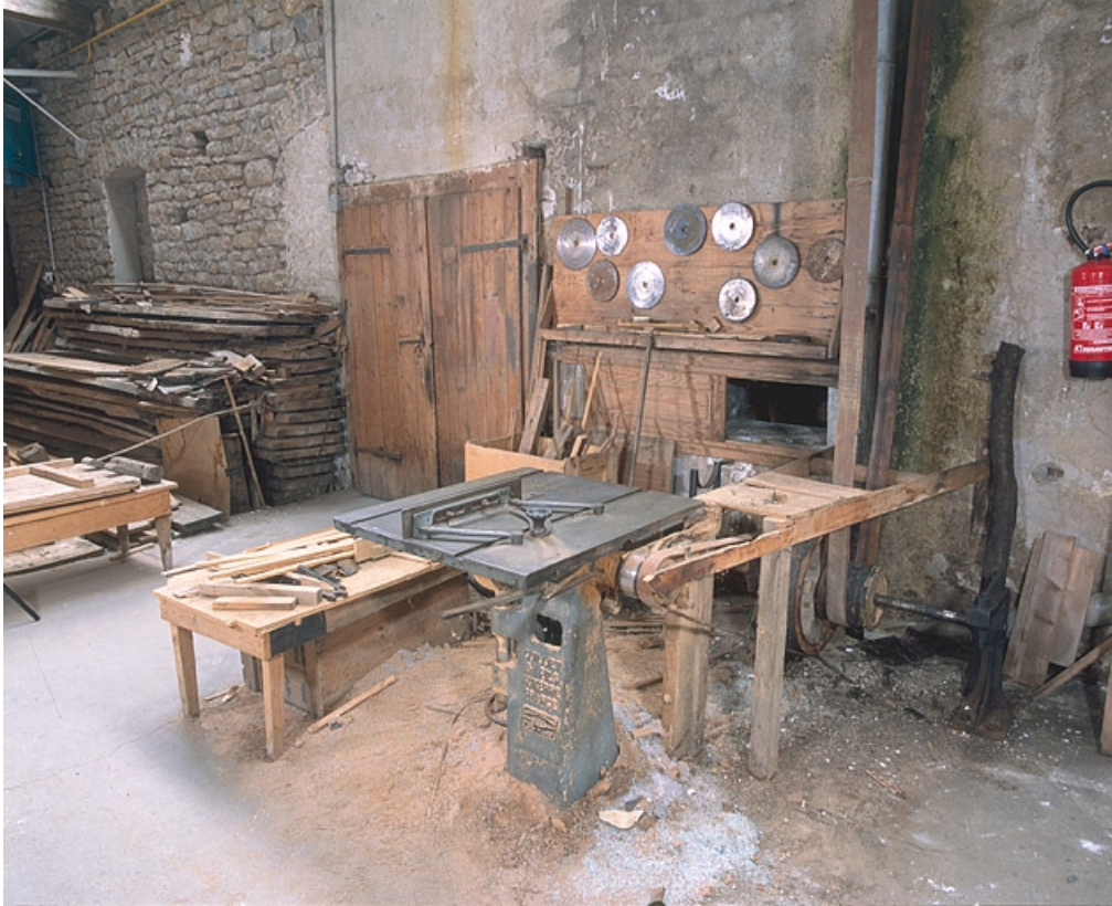
Vue plongeante sur la scie et son système d'entraînement.

25, Baume-les-Dames rue des Pipes, lieudit : Gondé