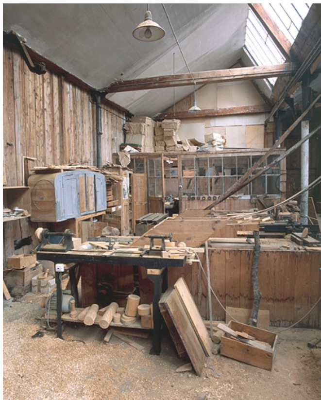
Vue d'ensemble de l'atelier depuis l'est.

25, Baume-les-Dames rue des Pipes, lieudit : Gondé