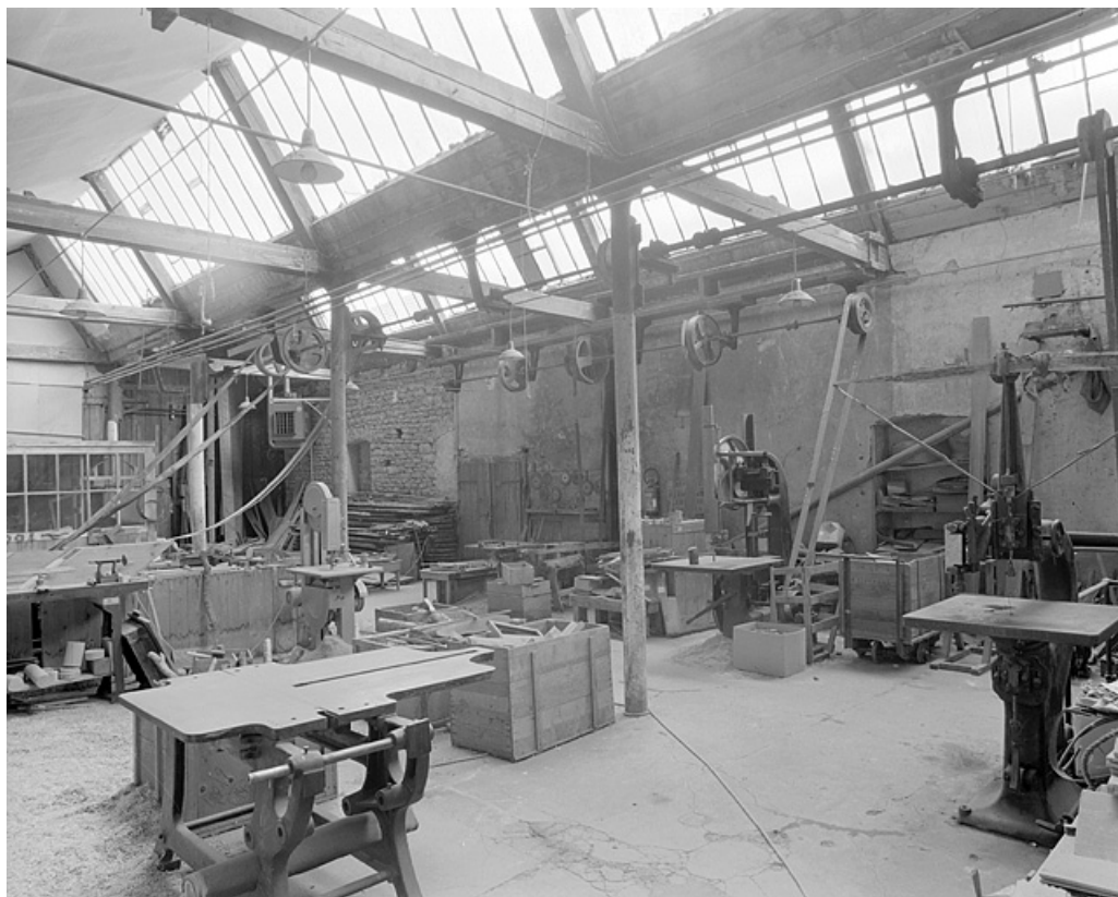
Vue d'ensemble de l'atelier depuis le sud-est.

25, Baume-les-Dames rue des Pipes, lieudit : Gondé