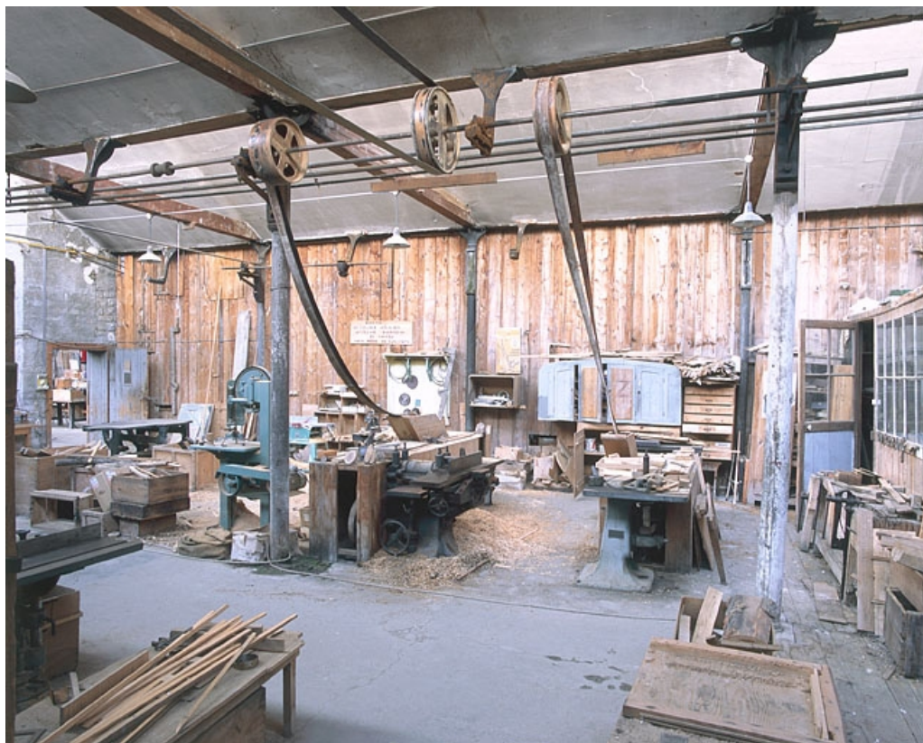
Vue d'ensemble de l'atelier depuis le nord.

25, Baume-les-Dames rue des Pipes, lieudit : Gondé