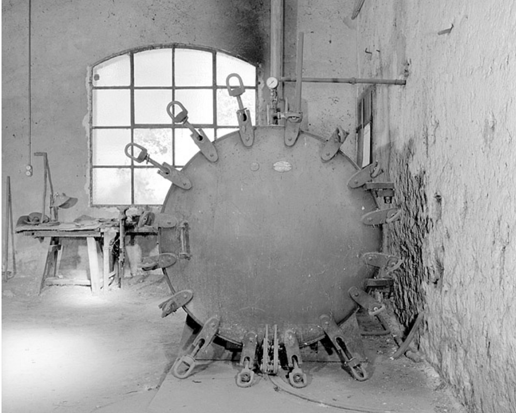
Vue de face : le couvercle et ses 16 attaches.

25, Baume-les-Dames rue des Pipes, lieudit : Gondé