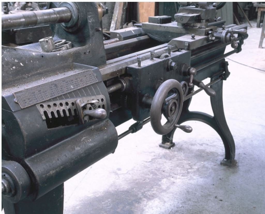
Détail de la boîte de vitesses et de la commande manuelle.

25, Baume-les-Dames rue des Pipes, lieudit : Gondé