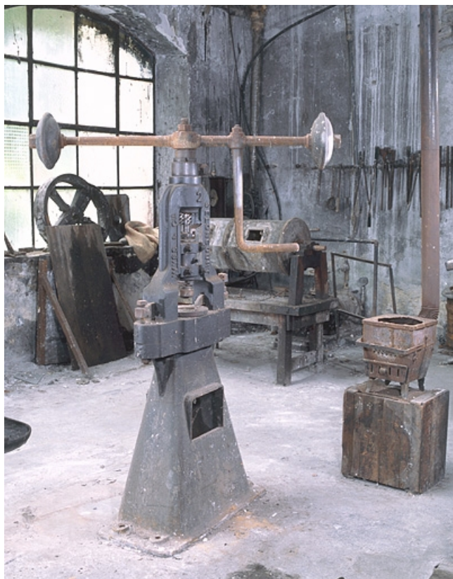
Vue depuis le sud-ouest.

25, Baume-les-Dames rue des Pipes, lieudit : Gondé