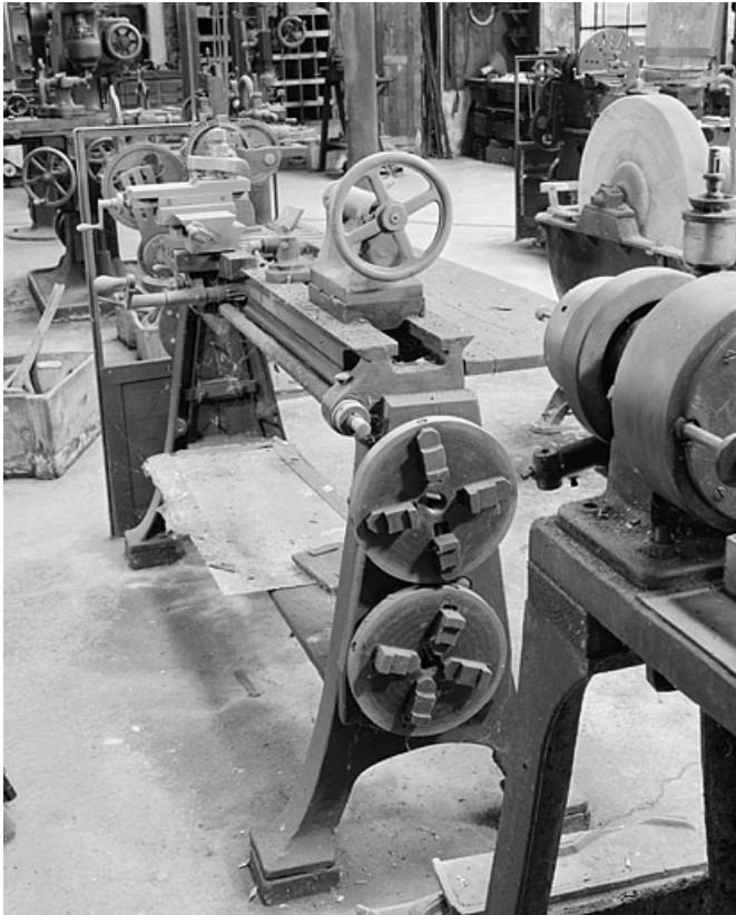
Vue de la vis-mère et du trainard.

25, Baume-les-Dames rue des Pipes, lieudit : Gondé