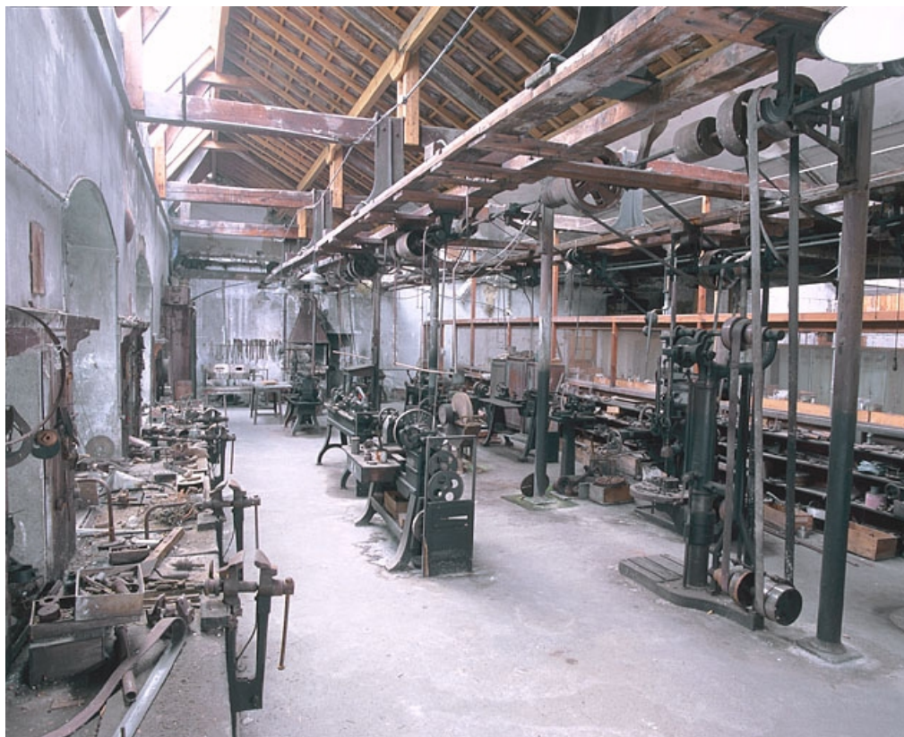
Vue d'ensemble depuis l'angle nord-ouest.

25, Baume-les-Dames rue des Pipes, lieudit : Gondé