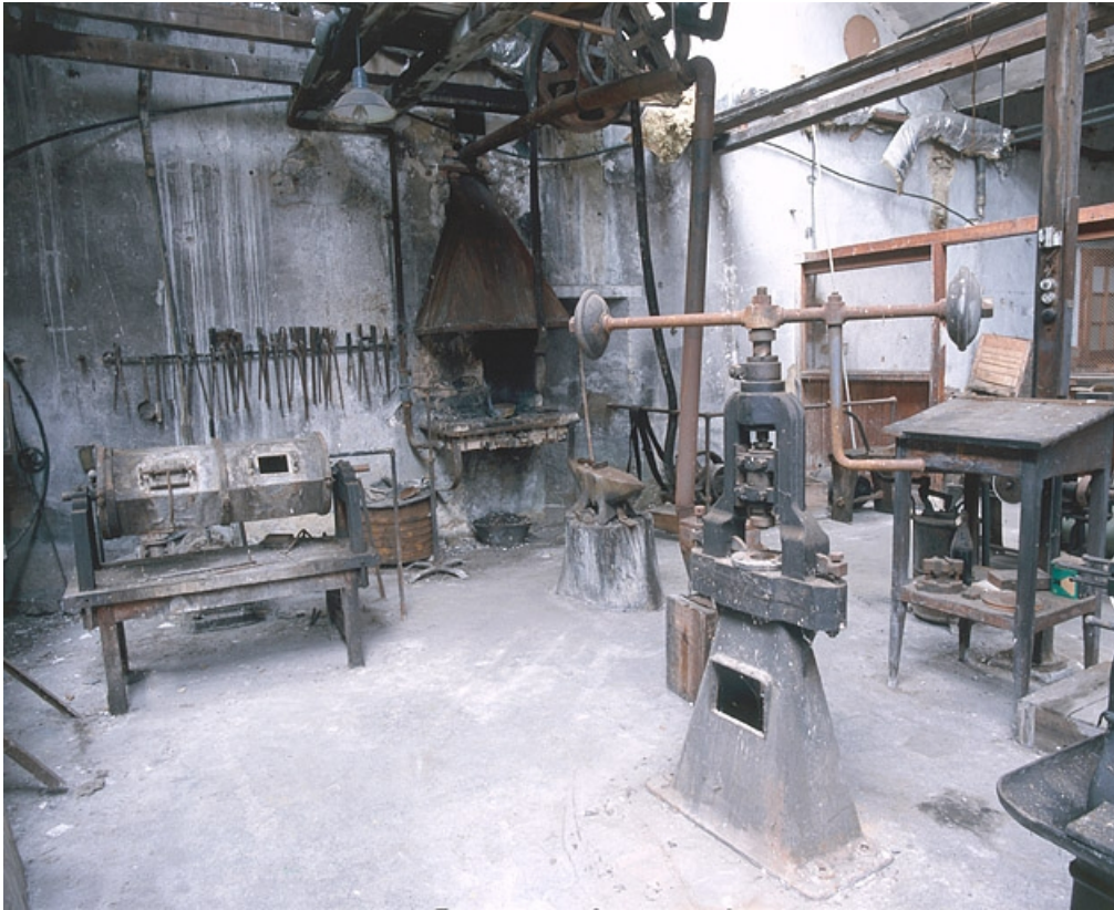
Vue de la forge.

25, Baume-les-Dames rue des Pipes, lieudit : Gondé