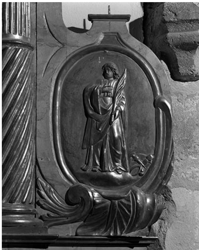
Saint Eloi (?). 25, Vuillafans