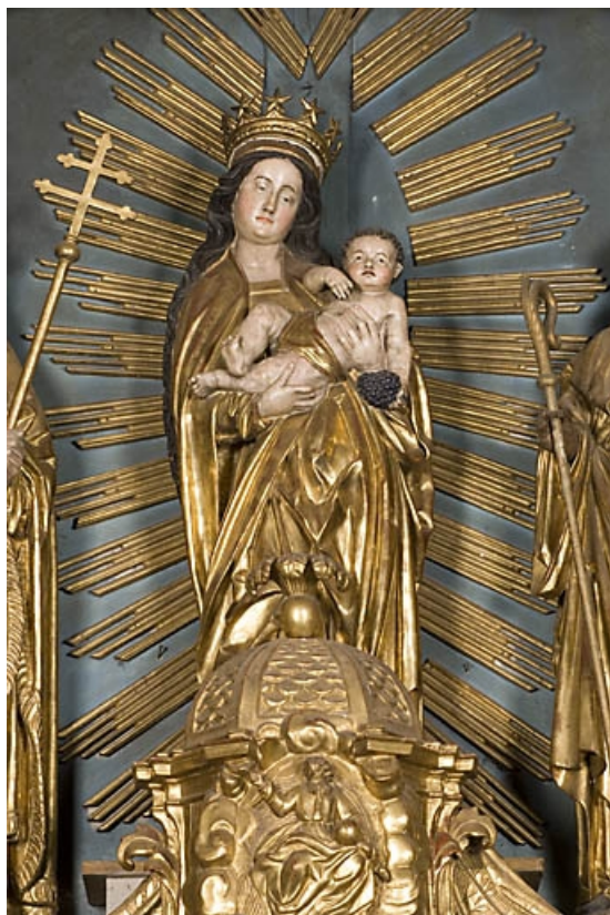
Vierge à l'Enfant, vue de face.