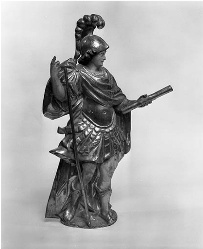
Saint Gengoulph : vue de profil droit. 25, Vuillafans