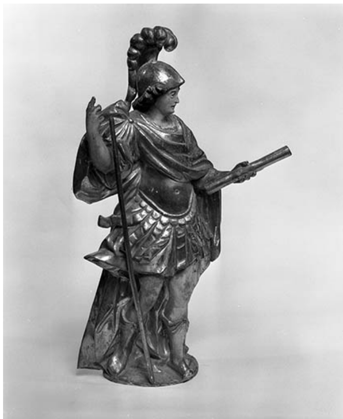
Saint Gengoulph : vue de profil droit. 25, Vuillafans