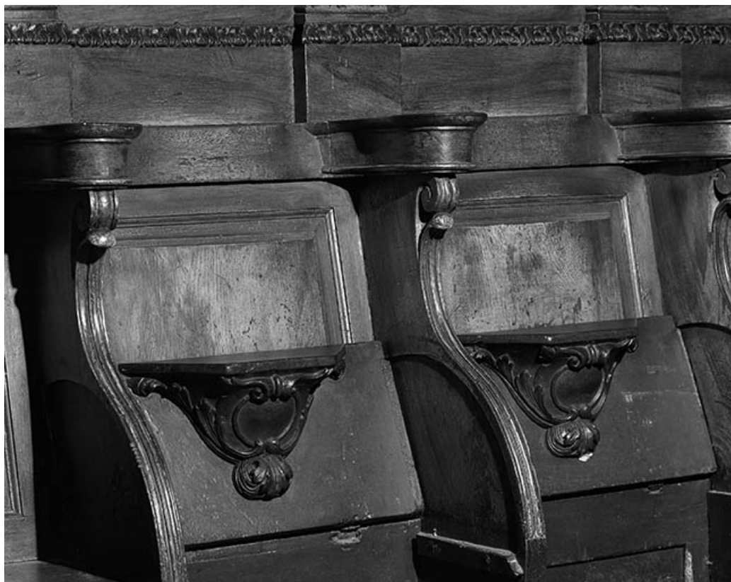
Vue de deux miséricordes.