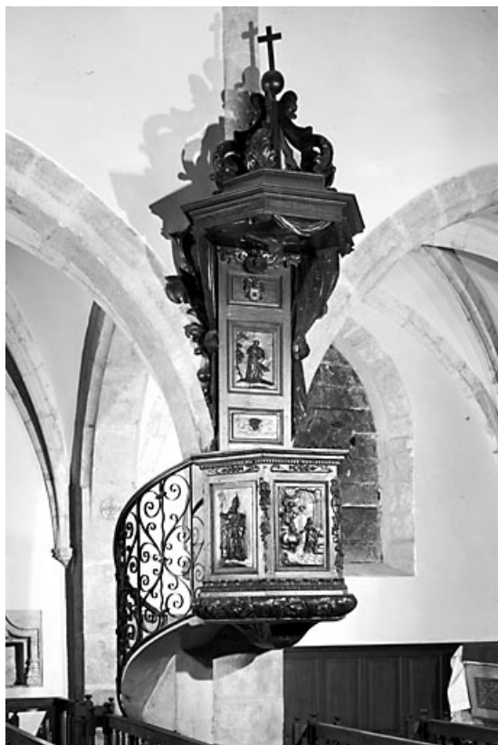
Vue d'ensemble. 25, Vuillafans