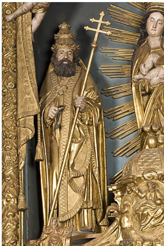
Saint Pierre, vue de face. 25, Vuillafans