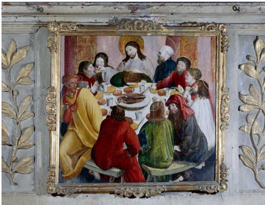
La Cène. 25, Vuillafans