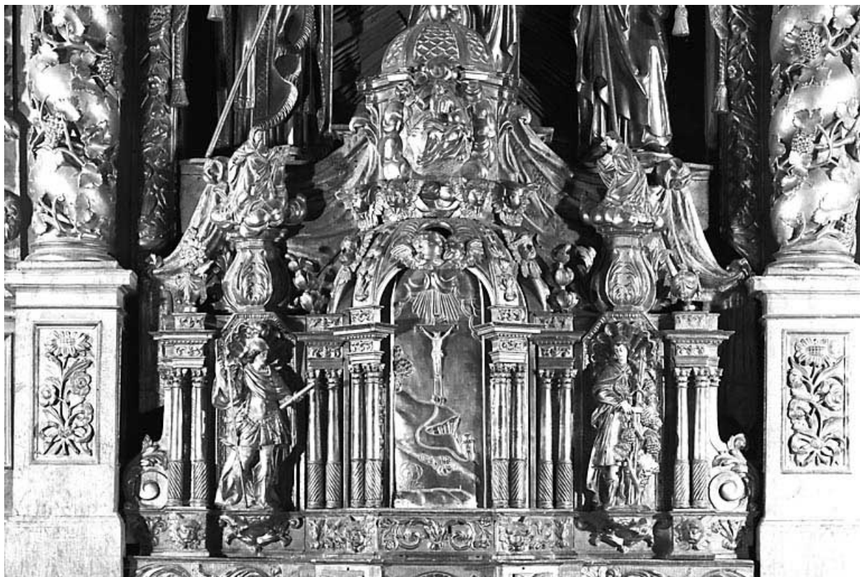
Vue d'ensemble. 25, Vuillafans