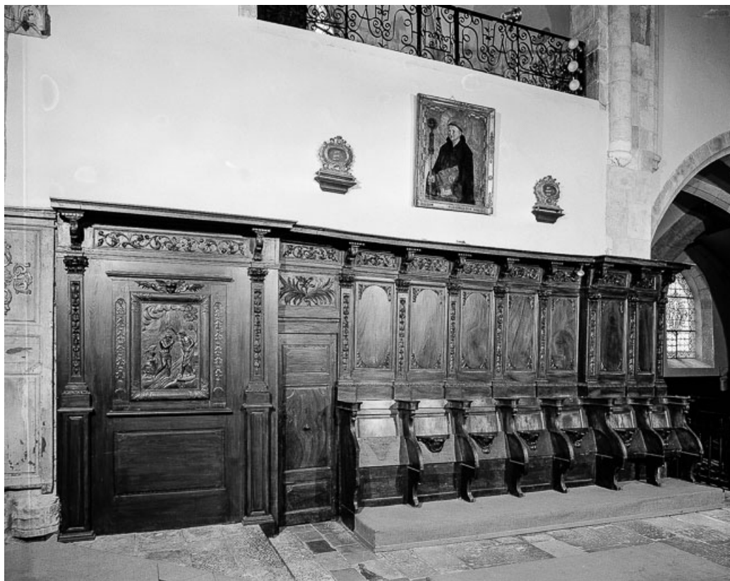
Vue d'ensemble côté sud en direction de la nef. 25, Vuillafans