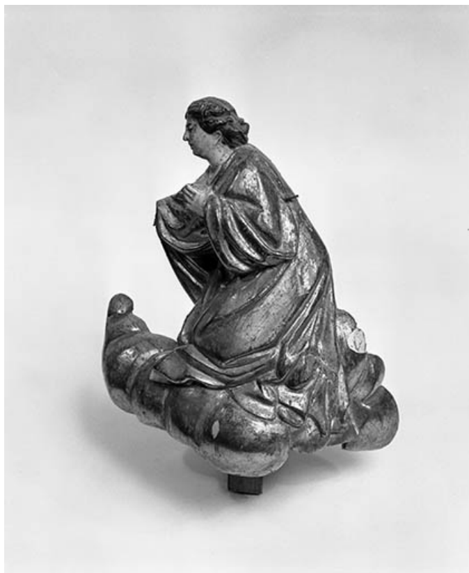
Ange de l'Annonciation.