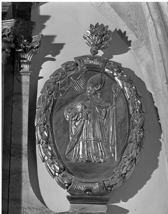
Saint Antide. 25, Vuillafans