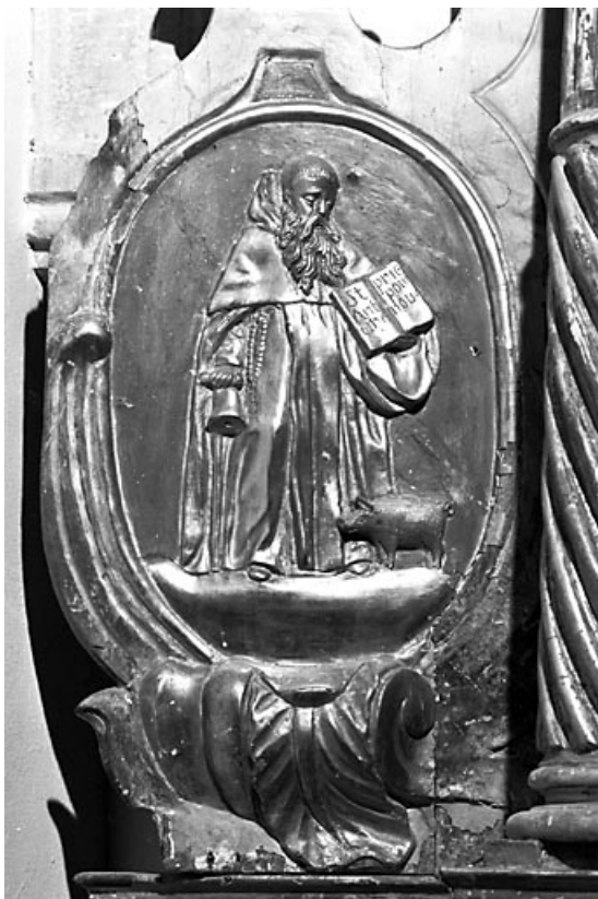
Saint Antoine. 25, Vuillafans