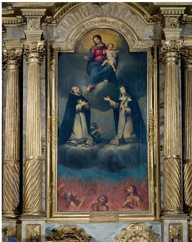
Vue générale. 25, Vuillafans