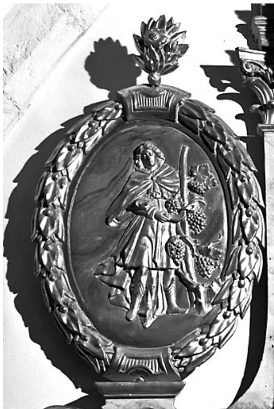
Saint Vernier. 25, Vuillafans