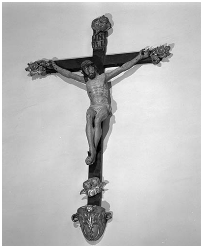
Vue de trois quart droit.