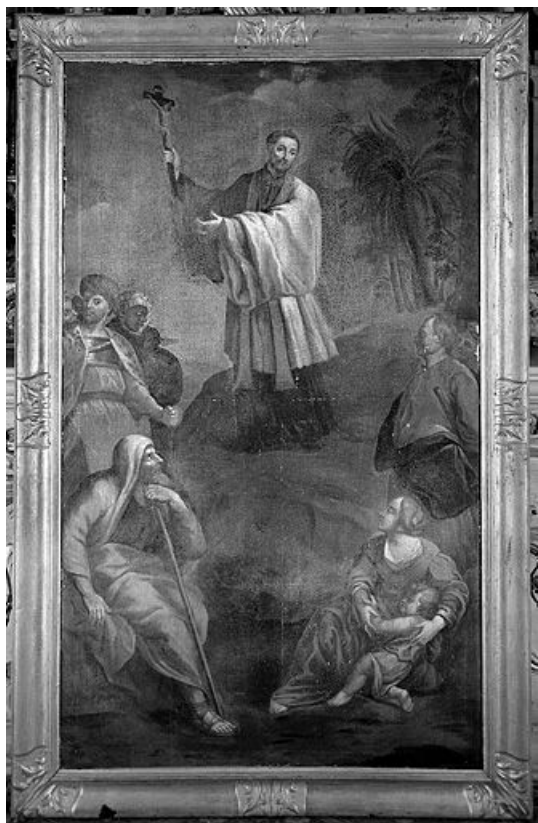
Saint François Xavier évangélisant les Indiens.