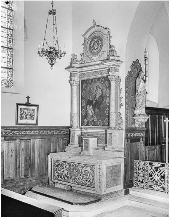
Vue d'ensemble de l'autel du Rosaire. 25, Villers-sous-Montrond