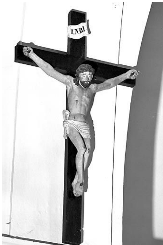
Vue de trois quart droit. 25, Villers-sous-Montrond