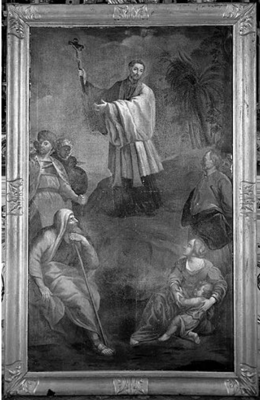
Saint François Xavier évangélisant les Indiens.