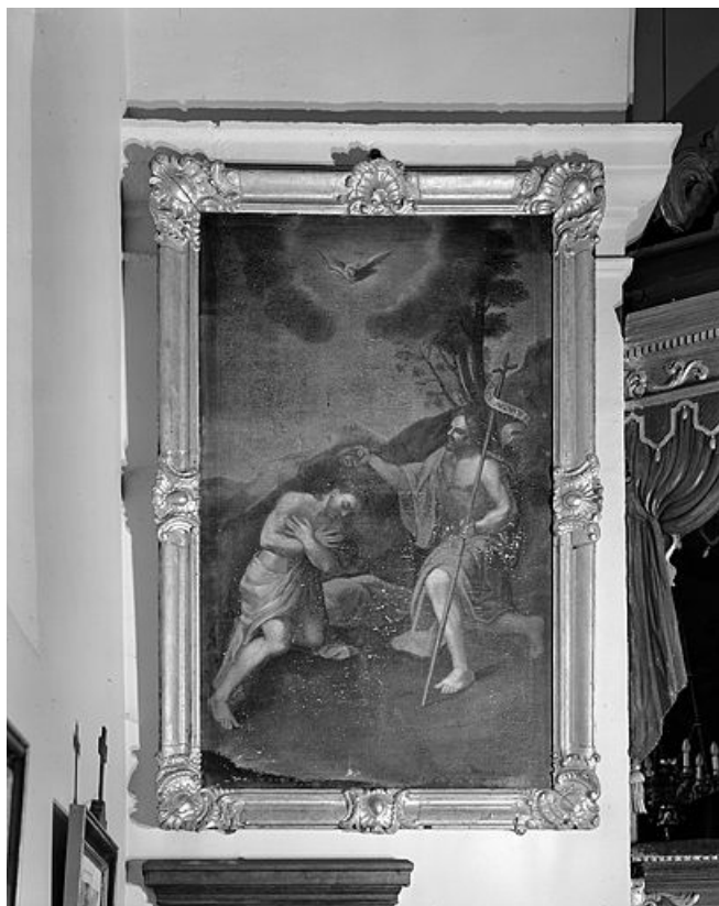
Baptême du Christ.