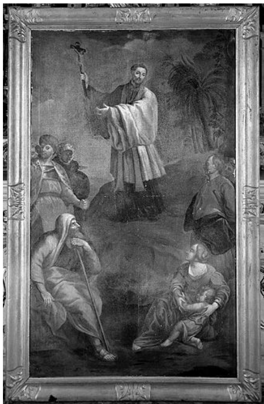
Saint François Xavier évangélisant les Indiens. 25, Villers-sous-Montrond