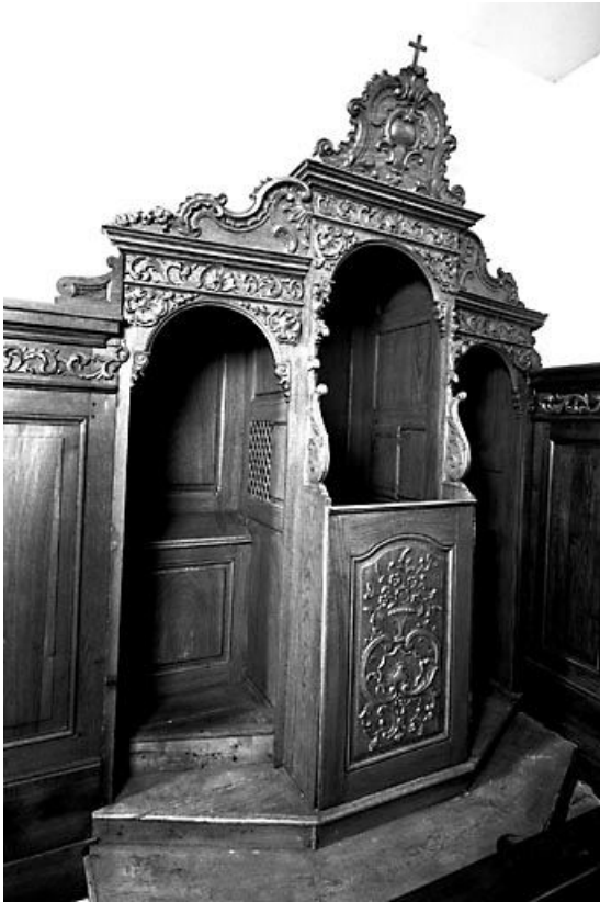
Vue d'ensemble du confessionnal du bas-côté nord. 25, Villers-sous-Montrond