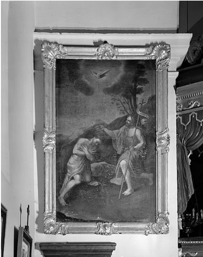
Baptême du Christ.