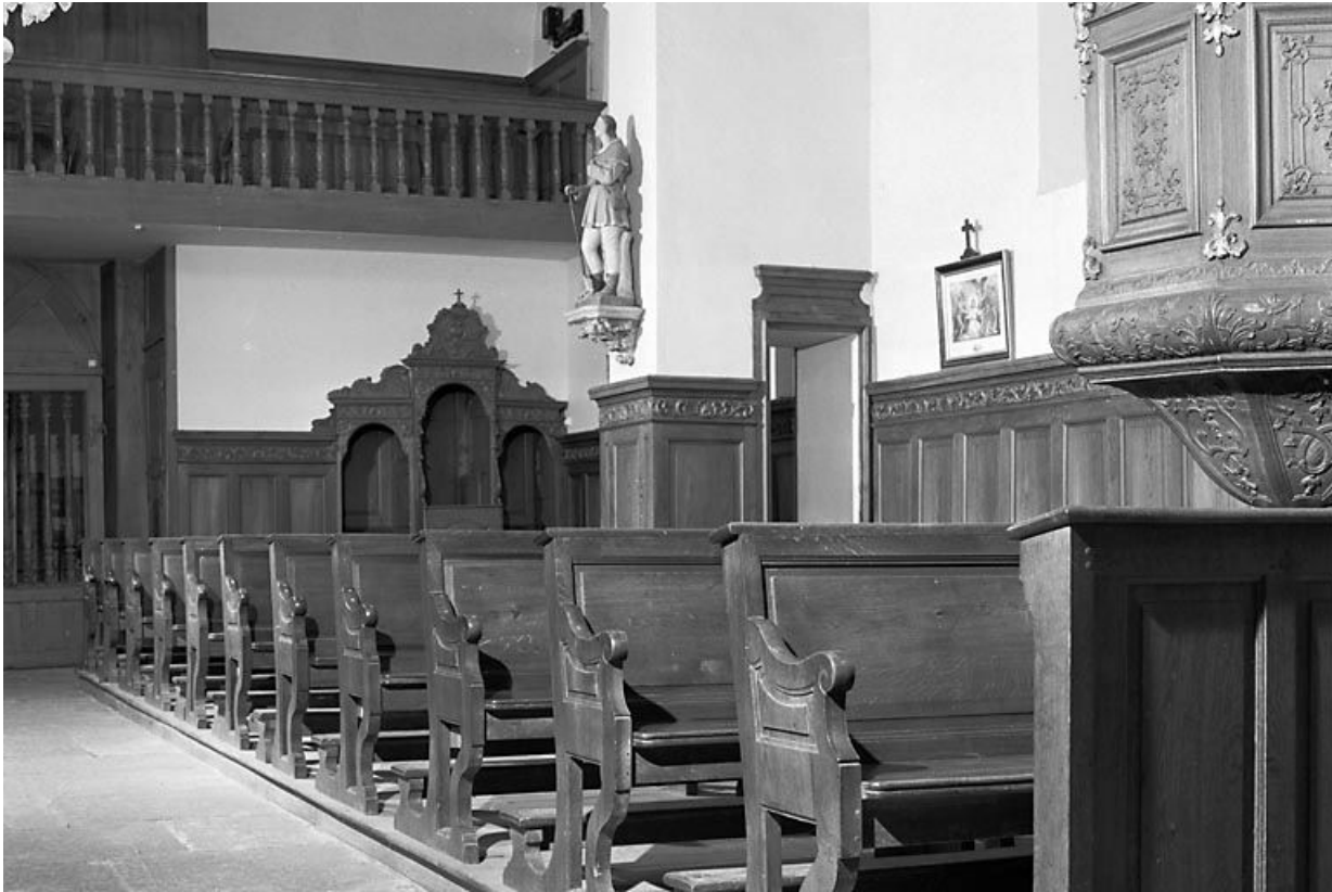
Vue d'ensemble des bancs de fidèle côté nord.