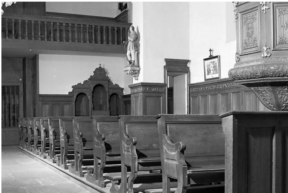
Vue d'ensemble des bancs de fidèle côté nord. 25, Villers-sous-Montrond