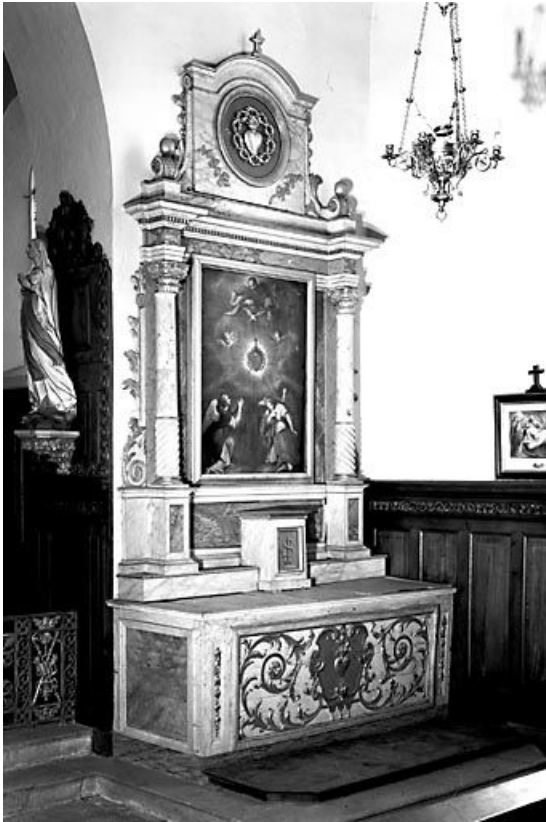
Vue d'ensemble de l'autel du Sacré Cœur. 25, Villers-sous-Montrond