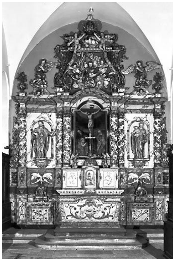
Vue d'ensemble. 25, Scey-Maisières