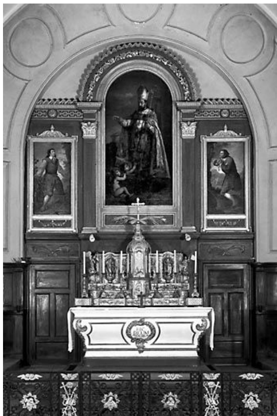
Vue d'ensemble. 25, Saules