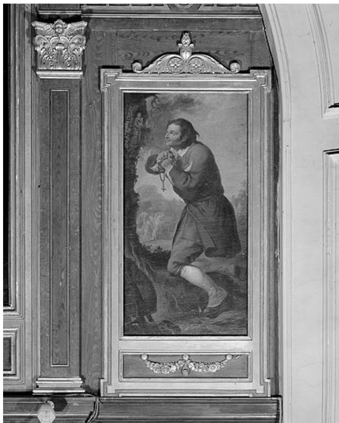
Saint Isidore. 25, Saules