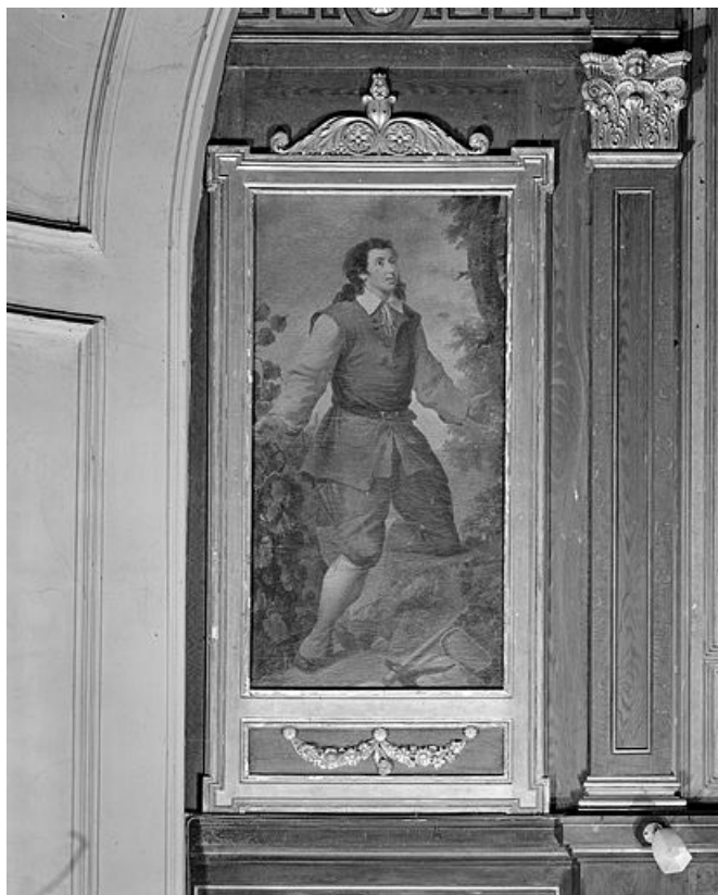
Saint Vernier. 25, Saules