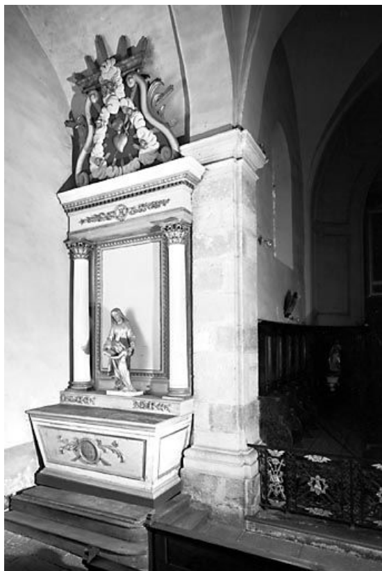
Vue d'ensemble. 25, Saules