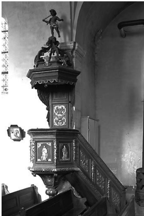
Vue d'ensemble. 25, Saules