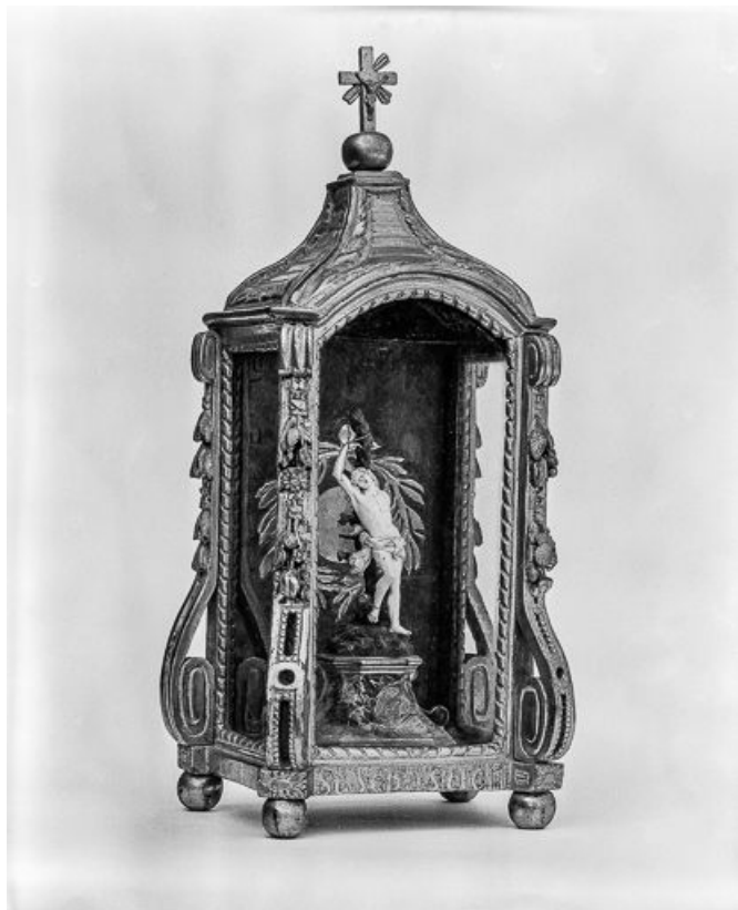
Vue d'ensemble. 25, Montgesoye