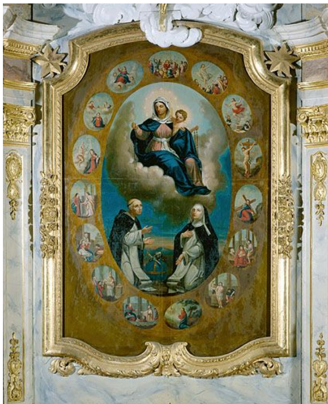
Vue générale. 25, Montgesoye