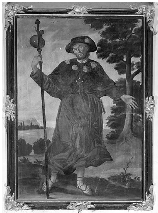
Vue générale. 25, Montgesoye