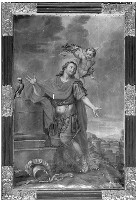
Vue générale. 25, Montgesoye