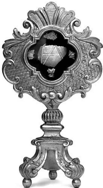
Vue d'ensemble. 25, Montgesoye