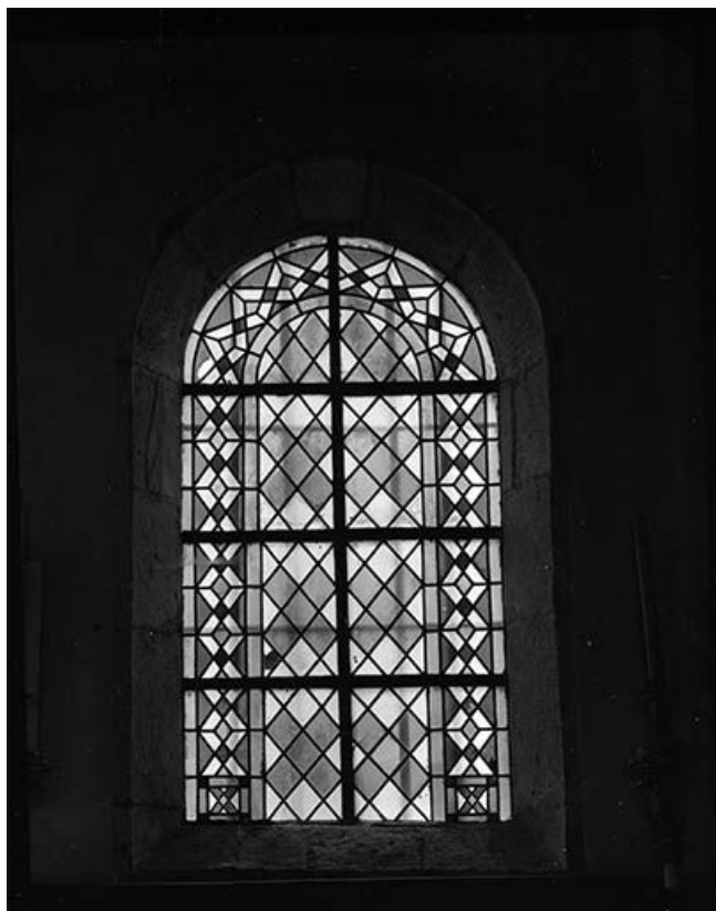
Vue générale de la baie n° 3. 25, Montgesoye