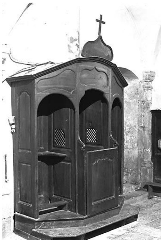
Vue d'ensemble. 25, Montgesoye