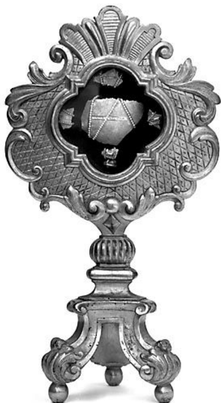
Vue d'ensemble. 25, Montgesoye