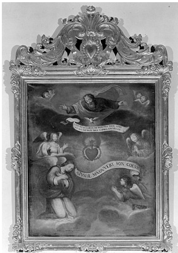
Vue générale. 25, Montgesoye