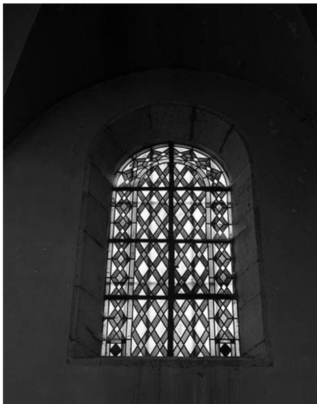
Vue générale de la baie n° 101.