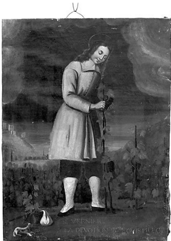
Vue générale. 25, Montgesoye