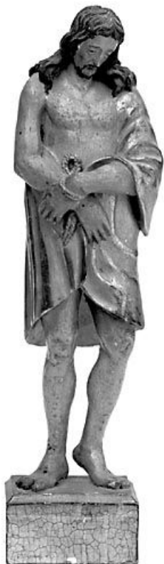
Christ aux liens.