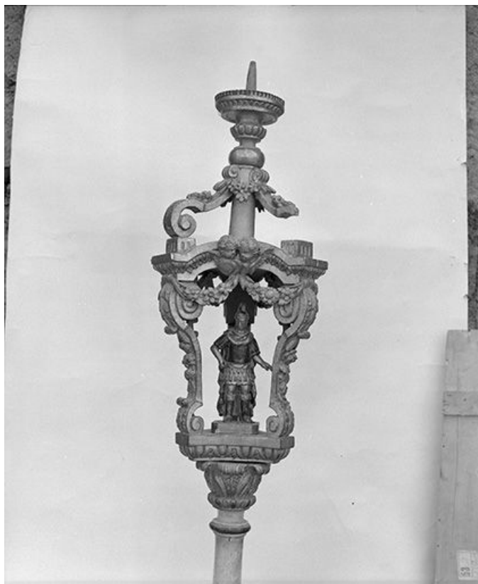
Vue d'ensemble du porte-cierge de procession de saint Gengoulph. 25, Montgesoye