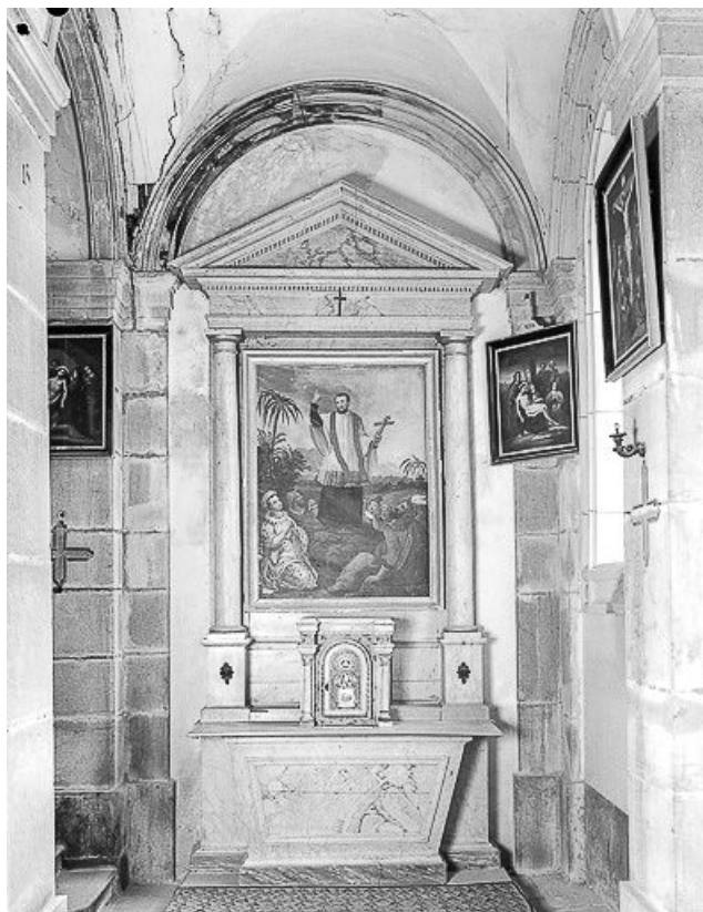
Autel secondaire sud. 25, Mérey-sous-Montrond