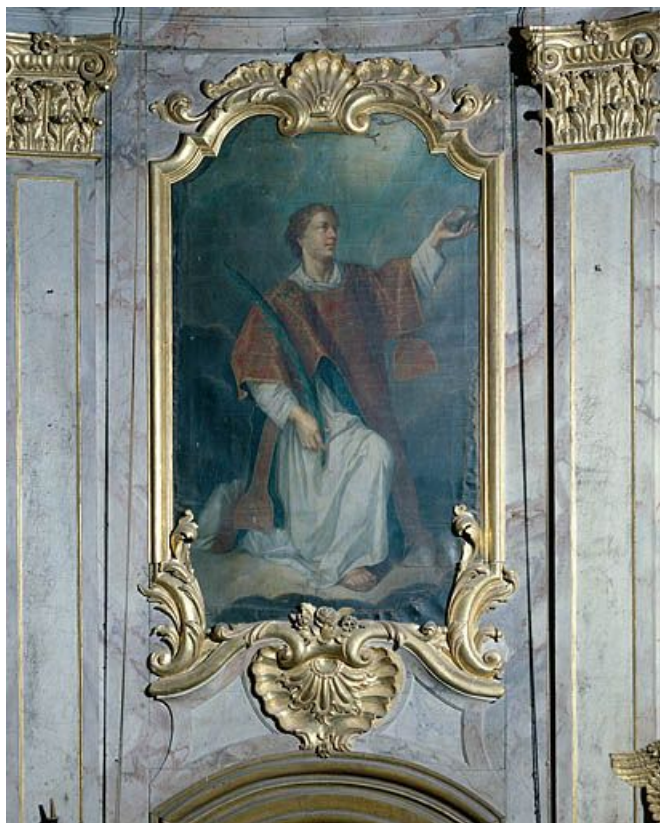
Saint Etienne. 25, Lods