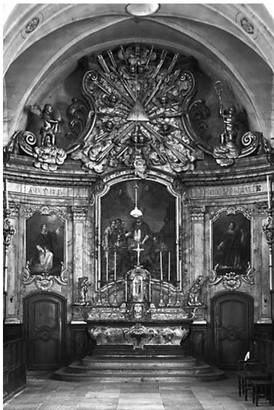
Vue d'ensemble. 25, Lods