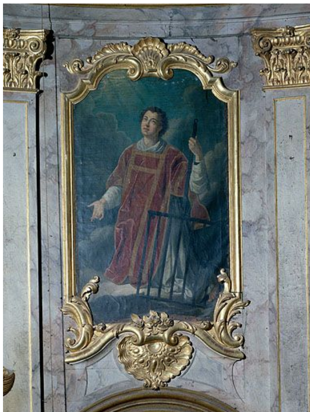
Saint Laurent. 25, Lods