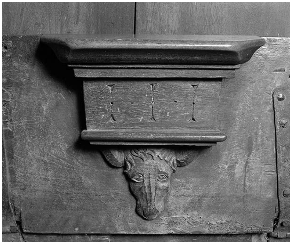
Détail : miséricorde côté nord n° 2. 25, Lods