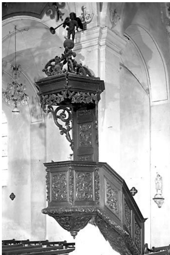
Vue d'ensemble. 25, Lods