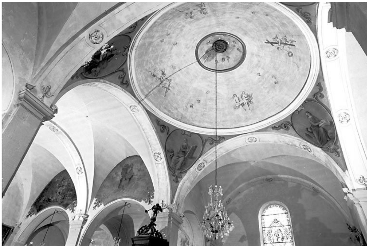
Vue d'ensemble. 25, Lods