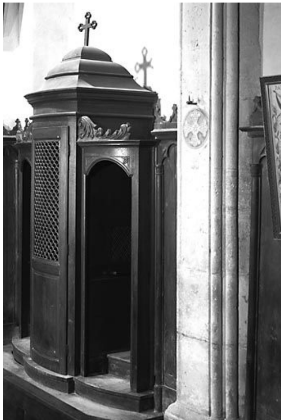
Vue d'ensemble d'un confessionnal.