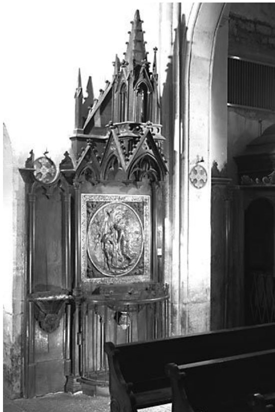
Vue d'ensemble. 25, Guyans-Durnes