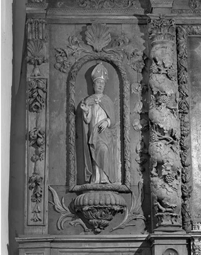
Saint Claude (?).