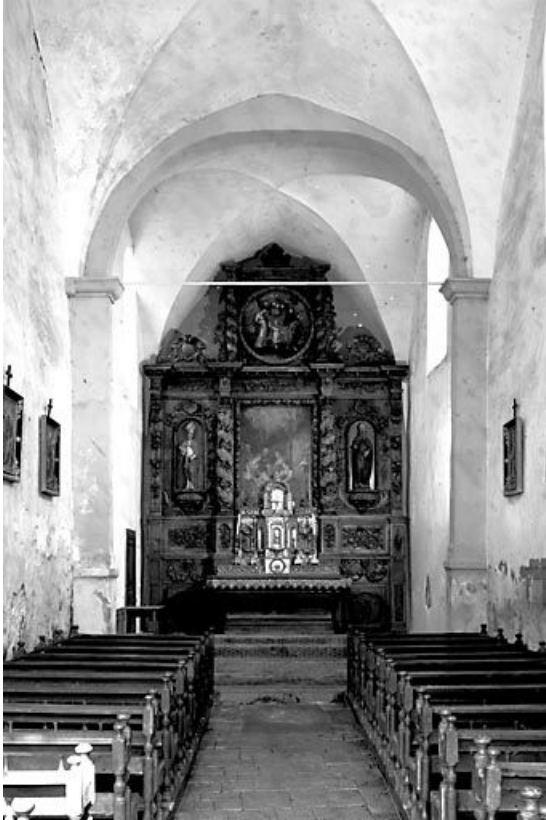
Intérieur : la nef et le chœur vus depuis l'entrée. 25, Châteauneuf-les-Fossés rue Ferdinand de Rye