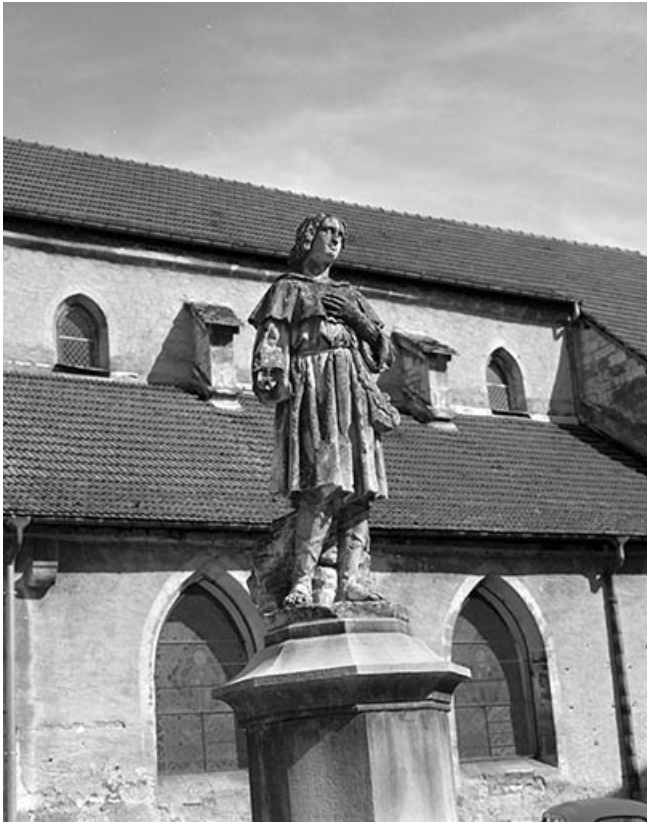
Vue de trois quart droit. 25, Vuillafans